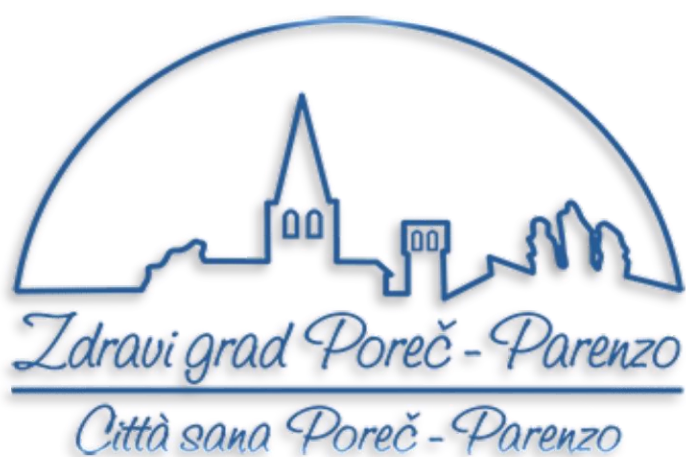
Slika 2. Logo "Zdravog grada Poreč"

Izvor: https://www.zdravi-grad-porec.hr/