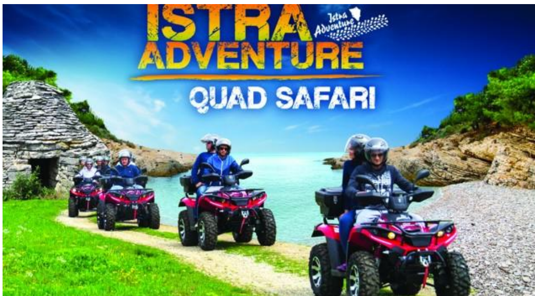
Slika 3. Quad safari