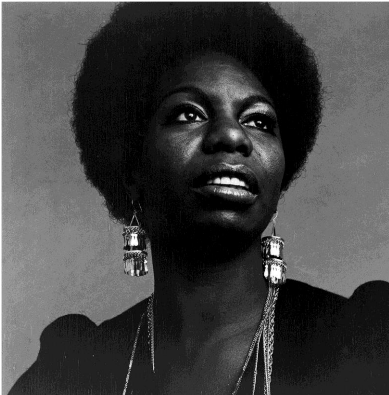
Slika 6. Nina Simone