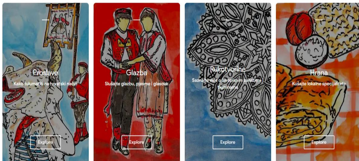
Slika 2. Prikaz izbornika stranice „Croatia: Hearts & Crafts“