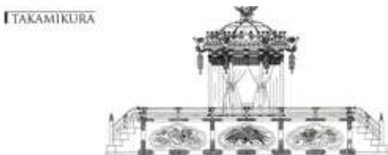
Slika 3: Takamikura

Ozawa u svojoj knjizi također pobliže opisuje same vrste i stilove mikoshija. Sam mikoshi se može opisati kao „kočija“ božanstva do svetišta u kojem pripada, a postoje dvije vrste: miya mikoshi ili službeni mikoshi svetišta te machi mikoshi ili mikoshi udruge lokalnog susjedstva (Ozawa, 1999: 113). Što se tiče stila mikoshija, postoje također dvije vrste, a to su Kansai stil i Kanto stil. Kansai stil je stariji te se smatra kako je potekao iz imitacije takamikura 9 , dok kod Kanto stila, područje odmah iznad daiwa , odnosno baze na kojoj gornja struktura leži, namijenjeno je kako bi se sugerirala oblast šintoističkih svetišta (Ozawa, 1999: 113).