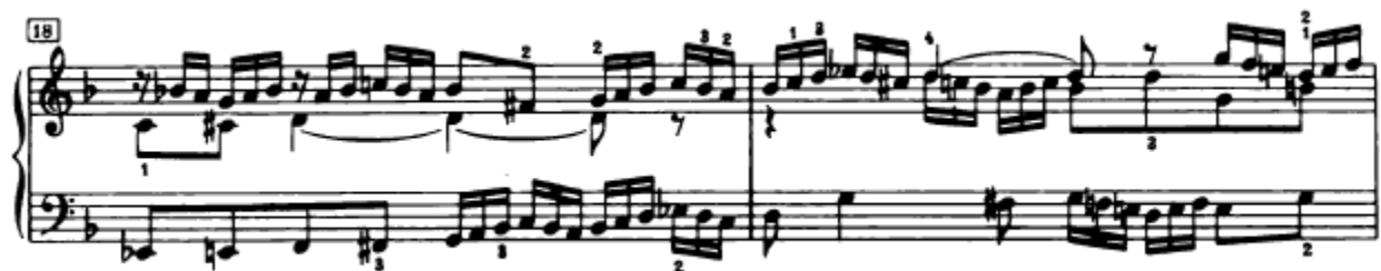
Slika 4.1.14. Tema u streti

Odmah nakon ovog nastupa teme u inverziji u tenoru, isti glas nastavlja s novim izlaganjem teme u 18. taktu, ovaj put u osnovnom ali nepotpunom obliku (g-mol). Slijedi još jedna streta na oktavi, također u razmaku od samo jedne dobe gdje sopran donosi temu, također nepotpunu (Slika 4.1.14.).