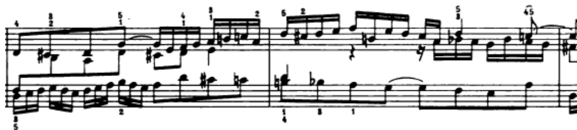
Slika 4.1.4. Treći nastup teme

Nakon toga u 6. taktu slijedi treći nastup teme u tenoru, u osnovnom tonalitetu (Slika 4.1.4.). Za to vrijeme u sopranu se javlja kontrasubjekt.