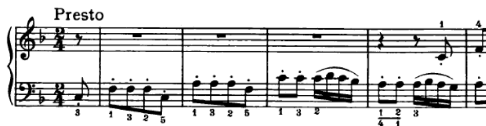
Slika 4.2.1. Polifona tema u basu

Ekspozicija traje od 1. – 32. takta. Stavak počinje s temom polifone građe koja kreće u basu i traje četiri takta (Slika 4.2.1.). Dinamika je mezzopiano , a način izvođenja staccato . Budući da se ovdje radi o polifonoj temi koja će biti prisutna i u daljnjem tijeku stavka, vrlo je važno da se osminke u staccatu izvode točno i precizno, kako ovdje tako i pri svakom sljedećem nastupu teme.