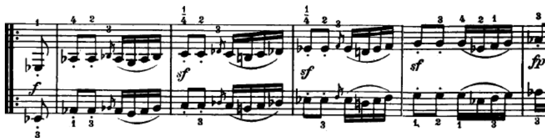
Slika 4.2.5. Početak provedbe

Nakon završetka druge teme u ekspoziciji slijedi razvojni dio (33. – 86. takt). U razvojnem dijelu se uglavnom razrađuje tematski materijal iz prve teme. Početak razvojnog dijela je u As-duru. Lijeva i desna ruka sviraju istu melodijsku liniju s motivom prve teme (Slika 4.2.5.).