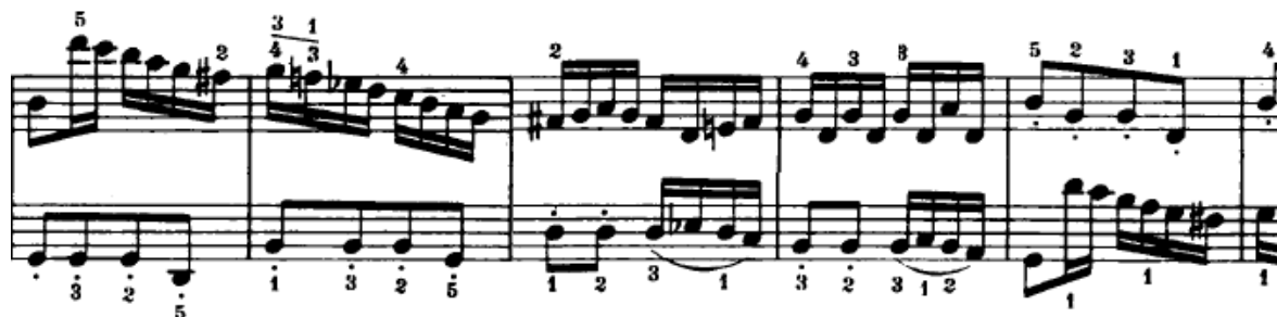
Slika 4.2.10. Most

Odmah nakon izlaganja prve teme javlja se most koji se nadovezivao na prvu temu i u ekspoziciji (Slika 4.2.10.). Tonalitet je g-mol.