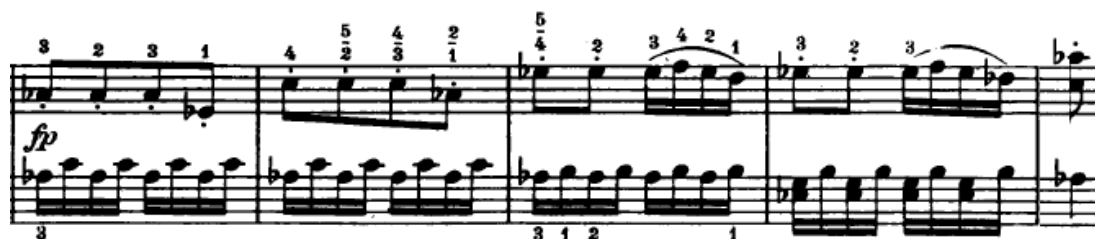
Slika 4.2.6. Tema u homofonom slogu

U nastavku se u desnoj ruci javlja izmijenjena tema s početka stavka, ovaj put u homofonom slogu jer linija u lijevoj ruci ovdje ima ulogu pratnje (Slika 4.2.6.). Dakle, može se zaključiti da je jedna od karakteristika ovog stavka i izmjena polifonije i homofonije. To je sasvim logično jer kako je već navedeno, radi se o dijelu sonatnog ciklusa iz razdoblja klasicizma – homofoni stil, a koji je građen na temi u polifonom stilu.