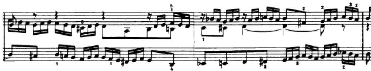
Slika 4.1.13. Inverzirana tema u streti

Slijedi vrlo zanimljiv nastup teme u streti (17. – 18. takt). U 17. taktu u altu se javlja odgovor u inverziji, a zatim opet odmah s početkom na drugoj dobi imamo stretu , gdje tenor donosi temu također u inverziji (Slika 4.1.13.). Ovdje se odvija modulacija iz d-mola u g-mol.