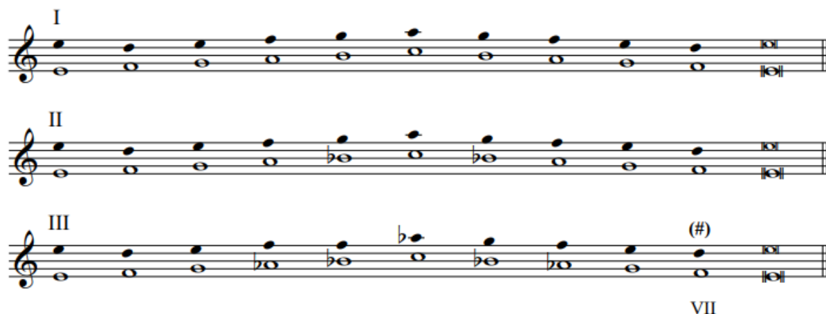
Slika 6. Tri varijante istarskog dvoglasja

Dalje je konstatirao da taj niz podliježe promjenama koje ga odvede bliže dijatonici i udaljuju od izvornog arhaičnog niza. To odstupanje pojavljuje se u tri varijante što ih je zabilježio na slijedeći način: