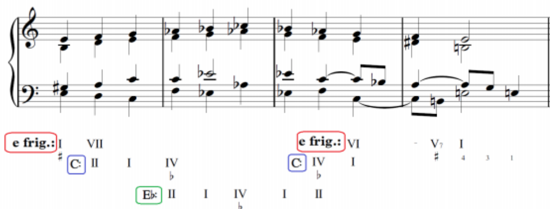
Slika 1. Matetićeve harmonizacija istarske ljestvice

Ivan Matetić Ronjgov 25 godina je radio na sakupljanju i proučavanju istarskih napjeva. Od toga je 128 zapisa objavljeno u „Čakavsko-primorskoj pjevanici“. Zanimljive su Matetićeve rasprave o definiranju istarskog tonskog niza iz časopisa Sv. Cecilija u kojemu je i njegova harmonizacija istarske ljestvice: