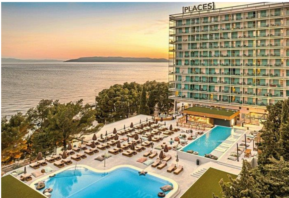
Slika 7. Valamarov hotel ,Dalmacija [PLACESHOTEL]