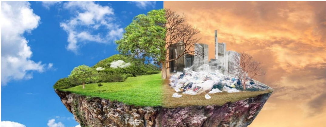
Slika 5. Različite vrste zagađenja