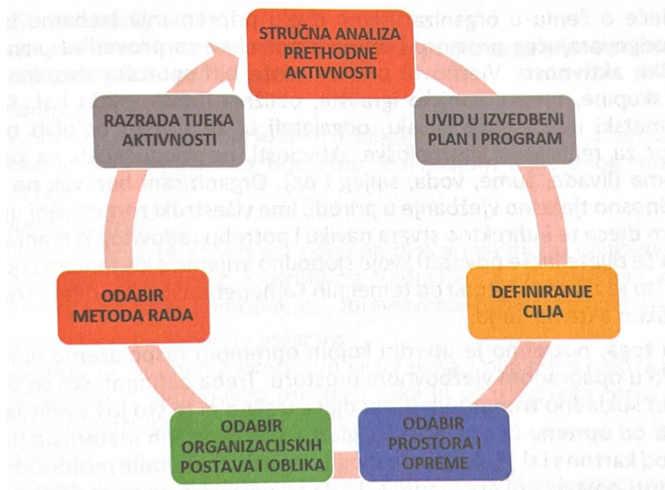
Slika 2. „Postupci organizacijskog pripremanja odgajatelja za kineziološke aktivnosti“ (Petrić, 2019: 131)

„Organizacijsko pripremanje odgajatelja za kineziološke aktivnosti odnosi se na metodičku pripremu za realizaciju tjelesnog vježbanja tijekom jedne konkretne aktivnosti. Može sa sagledati putem sljedećeg skupa smisleno povezanih postupaka odgajatelja: stručna analiza prethodne aktivnosti, uvid u izvedbeni plan i program, definiranje cilja, odabir prostora i opreme za tjelesno vježbanje, odabir organizacijskih postava i oblika, adekvatnih metoda rada te razrada tijeka aktivnosti.“ (Petrić, 2019: 130).