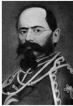
Slika 9. Eugen Kvaternik (1825.-1871.), hrvatski političar, https://enciklopedija.hr/clanak/kvaternik-eugen (19. lipnja 2024.)