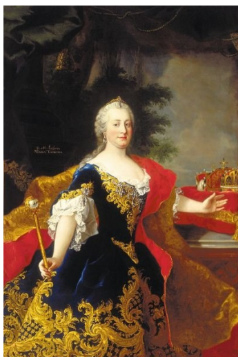
Slika 3. Marija Terezija (1717.-1780.), hrvatsko-ugarska kraljica i rimsko-njemačka carica, https://www.enciklopedija.hr/clanak/marija-terezija (19. lipnja 2024.)