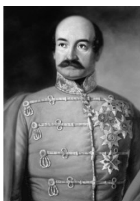
Slika 5. Josip Jelačić (1801.-1859.), hrvatsko-slavonsko-dalmatinski ban, https://enciklopedija.hr/clanak/jelacic-josip (19. lipnja 2024.)