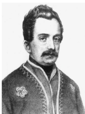
Slika 4. Ljudevit Gaj (1809.-1872.), vođa Hrvatskoga narodnoga preporoda, https://www.enciklopedija.hr/clanak/gaj-ljudevit (19. lipnja 2024.)