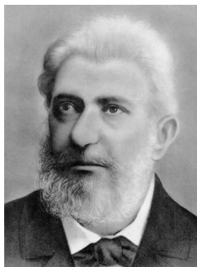
Slika 7. Ante Starčević (1823.-1896.), hrvatski političar, https://enciklopedija.hr/clanak/57830 (19. lipnja 2024.)