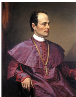
Slika 6. Josip Juraj Strossmayer (1815.-1905.), đakovački biskup