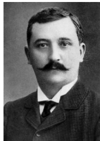
Slika 10. Frano Supilo (1870.-1917.), hrvatski političar i publicist, https://www.enciklopedija.hr/clanak/supilo-frano (19. lipnja 2024.)