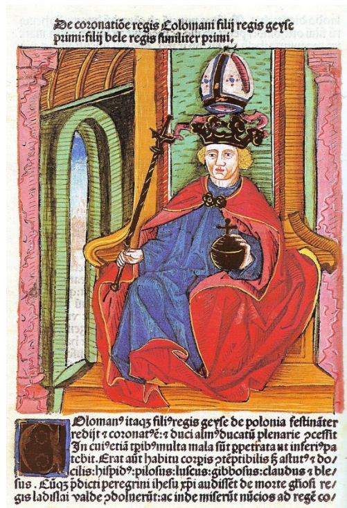
Slika 2. Koloman Arpadović, ugarski kralj 1095.-1116., hrvatski kralj 1102.-1116., https://hr.wikipedia.org/wiki/Koloman (7. travnja 2024.)