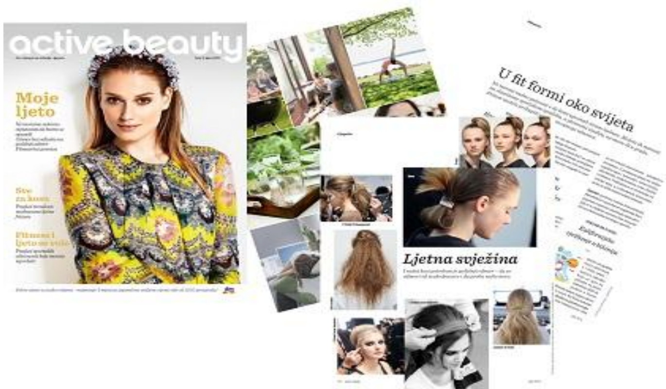
Slika 4: Primjer dm active beauty časopisa

Čitanje časopisa dostupno je i u online izdanju te se tako može čitati i putem interneta preko računala ili pametnih telefona.