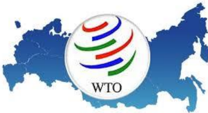
Slika br. 4 Simbol Međunarodne trgovinske organizacije