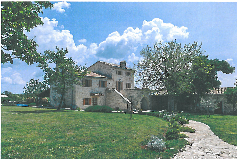
Slika 2. Obnovljena istarska stancija u općini Svetvinčenat