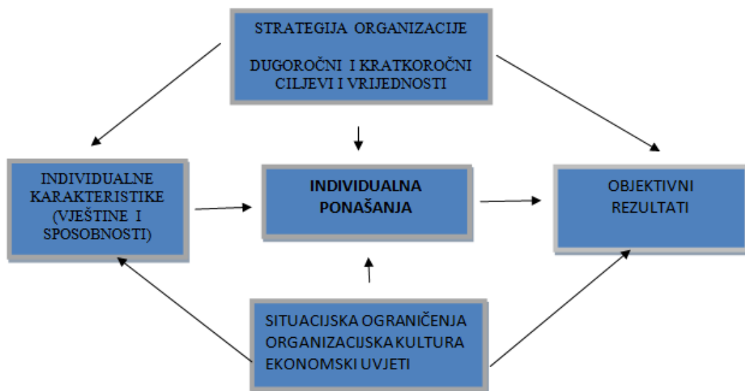
Slika broj 2.: Model upravljanja uspješnošću u organizacijama

Izradila autorica prema: Noe, R.A; Hollenbeck, J.R; Gerhart, B; Wright, M.P. (2006), Menadžment ljudskih potencijala. Mate d.o.o., str.277