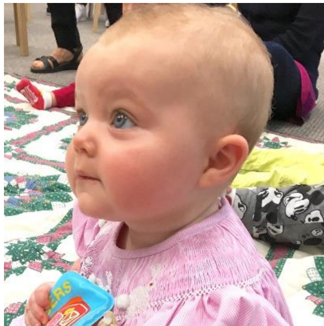
Fig.4 – Movimento dell'attenzione, ( https://littlelovelydotcom.files.wordpress.com/2016/04/img_6049.jpg , consultato il: 4 aprile 2016)