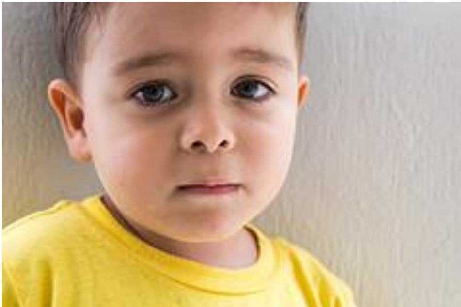
Fig.10 – Occhi incassati, ( https://favim.com/image/3828915/ , consultato il: 4 aprile 2016)