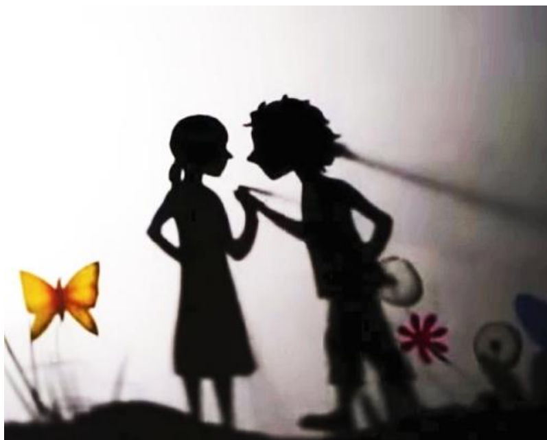
Slika 5: Prizor kazališta sjena

Osim što u kazalištu sjena možemo koristiti ruke, za glumu nam najčešće služe plošne lutke na štapićima. Lutke mogu imati pokretne dijelove, mogu biti napravljene od folija u boji, imati iscrtane detalje itd., sve navedeno pridonosi da lutke budu uočljivije i time ostaju duže u sjećanju gledatelja. Kazalište sjena nam omogućuje i igru sa svjetlom. Ako su lutke bliže platnu one će biti manje i vidjeti će se više detalja na njima, dok ako ih odmaknemo od platna biti će veće. Prilikom izrade važno je zapamtiti kako se radi poluprofil lutke jer se tako mogu najbolje istaknuti detalji lutke.