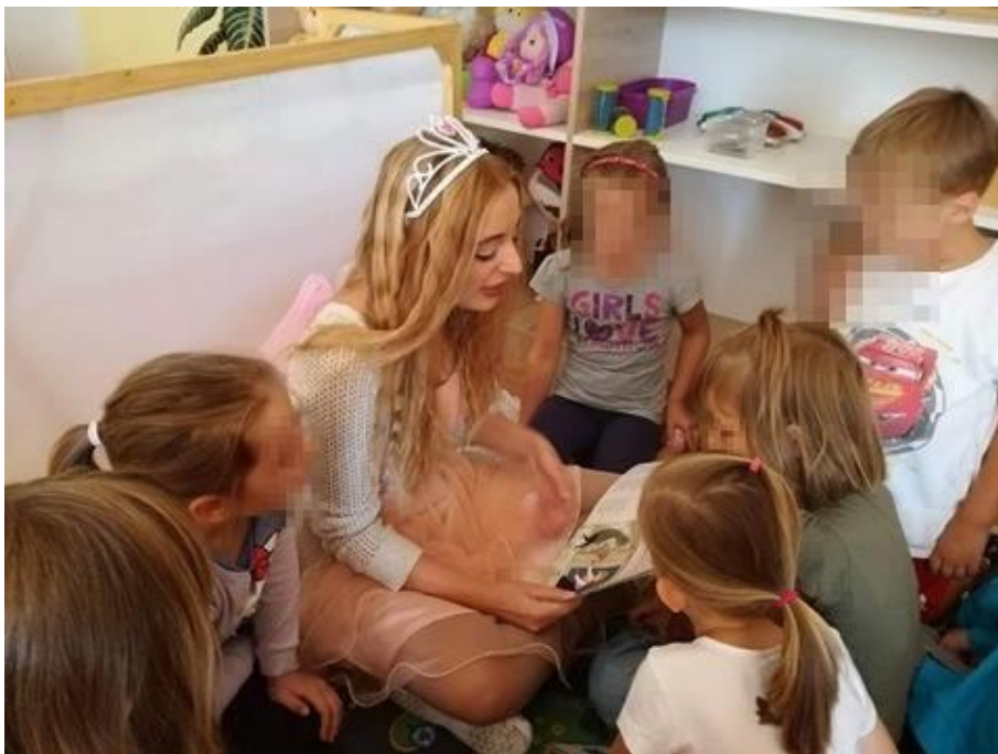
Slika 14: Čitanje Ježeve kućice