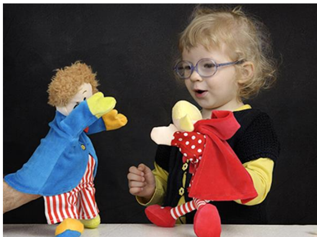
Slika 3 : Djevojčica pokazuje sreću igrajući se lutkom

Od svih lutaka za emocionalni razvoj posebno je važna lutka humaneta, tjelesna lutka koja prikazuje djetetov „alter ego”, visi oko djetetovog vrata, a ruke i noge su joj pričvršćene na djetetove. Dijete ima osjećaj kao da je skriveno te tako lakše izražava svoje osjećaje.