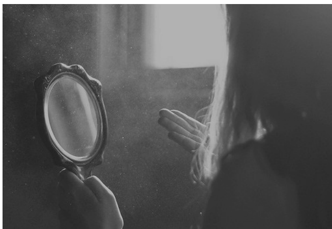
Slika 3: Refleksija unutarnjeg 21

Snaga misli je ključ za stvaranje vaše stvarnosti. Sve što vidimo u svijetu ima svoje porijeklo u nevidljivom, unutarnjem svijetu misli i uvjerenja. Svaki efekt koji možete vidjeti izvana ili u svijetu ima specifičan uzrok koji ima svoje porijeklo u unutarnjem ili mentalnom svijetu. To je suština misli moći. Okolnosti ne čine čovjeka, one ga otkrivaju. Svaki aspekt vašeg života točno i precizno otkriva vaše misli i uvjerenja. 20 Mnogi ljudi pogrešno misle da se osjećaju ili misle na određeni način zbog vanjskih okolnosti, ne znajući zapravo da je snaga njihovih misli ta koja stvara te okolnosti, kada napokon shvatite da misli kreiraju vašu stvarnost, sami ćete moći stvoriti promjene koju želite vidjeti u svom životu. Snaga vaših misli je neograničena, ona dolazi iznutra, a to su i potvrdili najveći mistici i učitelji koji su hodali Zemljom. Misli su prepune energije, one su žive. Svaki put kada se stvara misao, ona emitira vrlo specifičnu energiju koja odgovara određenoj frekvenciji ili vibraciji.