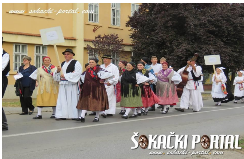
Slika: 5. KUD „Poljadija“ Grabarje