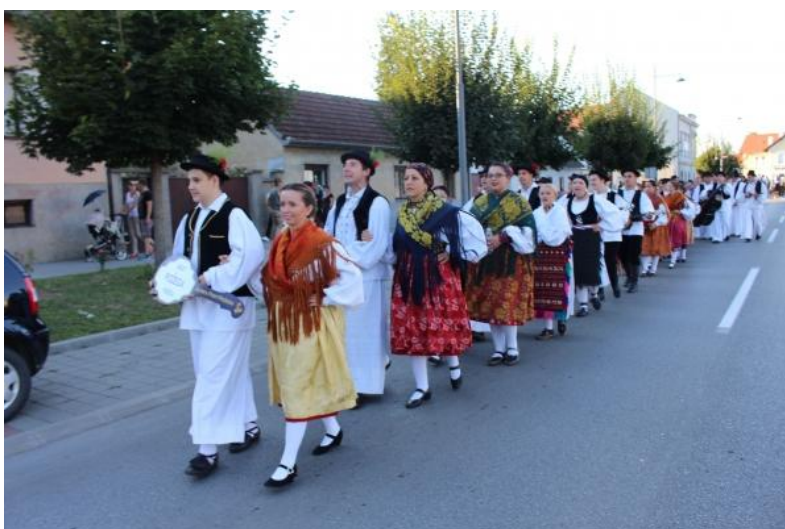
Slika 20: GKUD „Požega“ iz Požege

Gradsko kulturno umjetničko društvo „Požega“ iz Požege nastalo je 2005. godine te od njegovog nastanka redovno se sastoji od oko 80 aktivnih članova. Sastoji se od četiri sekcije: tamburaška, dječje plesna, odrasla plesna i pjevača sekcija.