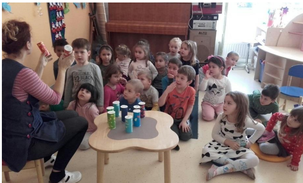
Slika 1: Prikaz glazbene aktivnosti, sviranje sa šušalicama