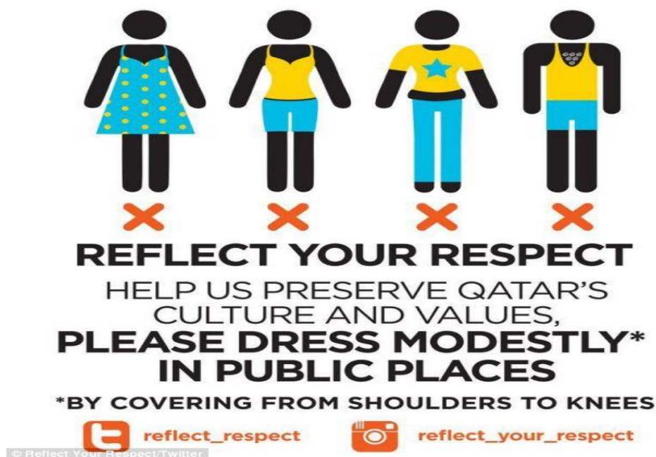
Slika 1: Javni apel vlade u Katru