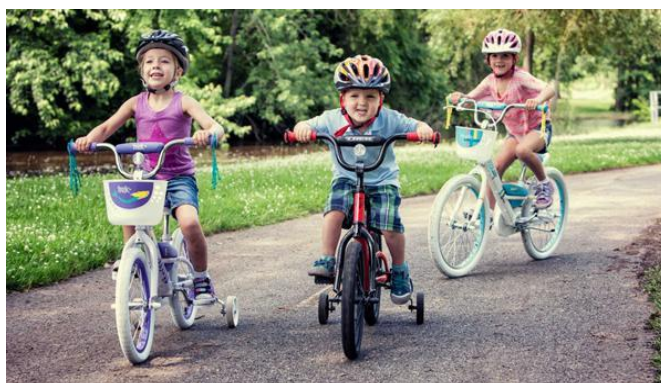
Slika 4. Tematsko vježbanje djece predškolske dobi

Tematsko vježbanje odnosi se na jednu planiranu tjelovježbenu aktivnost koju voditelj provodi i postavlja s djecom. To je jednostavan motorički zadatak koji se može ukratko upisati. Najčešće su nekonvencionalni motorički zadaci kojih ima onoliko koliko je bujna mašta odgajatelja npr. trčanje za balonima. Balon je dobar jer je ujedno i predvježba za rad s loptom i bezopasan je, zatim trčanje s obručem u rukama kao volanom, bacanje lopti u košaru za rublje i sl. Nakon što je voditelj postavio zadatak on prati vježbanje djece i po potrebi ga usmjerava ako se pojavi potreba za tim, npr. mogućnost ozljede. Postavljeni zadaci ovise o dobi djece, a upravo aktivnost djeteta određuje koliko će tematsko vježbanje trajati. Tematsko vježbanje kod djece mlađe dobne skupine traje nekoliko minuta, otprilike od pet do sedam minuta, u starijoj dobnoj skupini može potrajati od dvadeset do trideset minuta. Mlađu vrtićku skupinu može se uvesti u sat igre spajanjem nekoliko različitih tematskih zadataka.