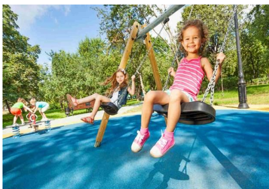
Slika 3. Spontano vježbanje djece predškolske dobi

Spontano vježbanje kod djece predškolske dobi odnosi se na aktivnost koja nije planirana već djeca samostalno provode aktivnost bez organizacije voditelja. Upravo su djeca ta koja biraju sadržaj koji će raditi, npr. ljuljanje na ljuljački, igra u pijesku, klackanje na klackalicama i sl. To su jednostavni kratki motorički zadaci kojima djeca usavršavaju biotička motorička znanja i razvijaju motoričke sposobnosti. Trajanje ove aktivnosti nije određeno, a djeca će s aktivnošću prestati kada im pažnju privuče neka druga aktivnost, kada se umore i sl. Spontano vježbanje trebalo bi se provoditi svakodnevno, ali ne smije biti zamjena za sat tjelesne i zdravstvene kulture. Uloga voditelja je da dobro prati aktivnost djece s ciljem čuvanja, ali se u aktivnost ne uključuje i ne usmjerava je. Ako je neko dijete započelo izvoditi prezahtjevan spontani tjelovježbeni zadatak za njegove mogućnosti, voditelj će tada prekinuti vježbanje i usmjeriti dijete na drugu djetetu primjerenu tjelovježbenu aktivnost.