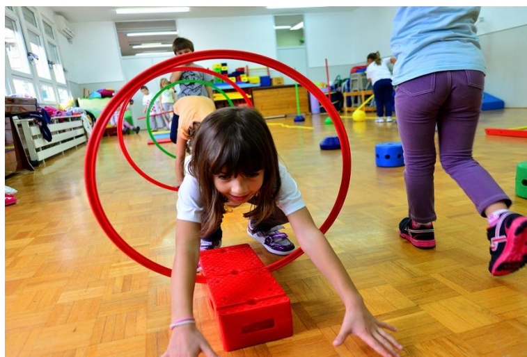
Slika 6. Sat tjelesne i zdravstvene kulture u vrtiću

Sadržaji završnog djela sata moraju biti umirujućeg karaktera i ne smiju izazivati velika opterećenja. Mogu se primjenjivati elementarne igre poput „Pogodi tko te zove“, razgovarati o satu, prati ruke i umivati se i sl.