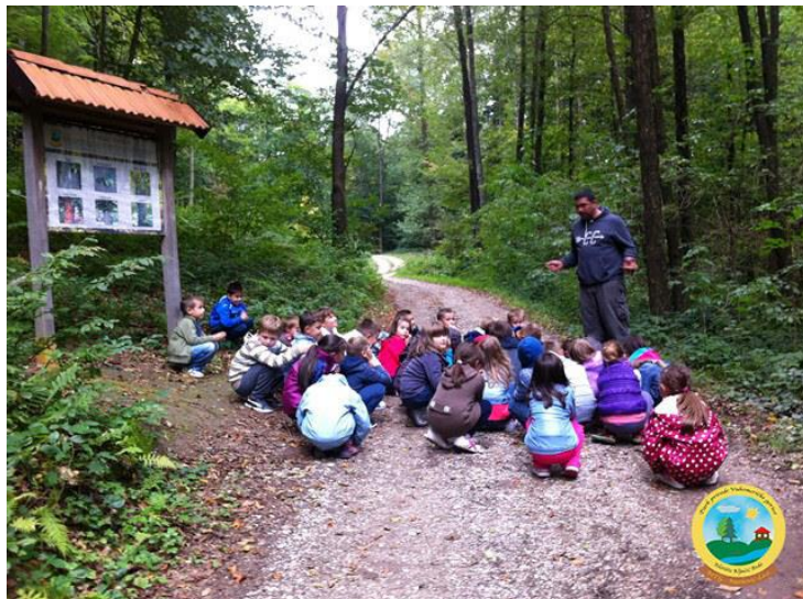
Slika 8. Djeca predškolske dobi na izletu

Izlete je važno provoditi s djecom predškolske dobi, jer se upravo kroz izlete djeca upoznaju s prirodom i uče kako se njome koristiti. Izleti se mogu temeljiti na pješaćenju ili mogu biti kombinacija pješaćenja i prijevoza. Kako bi izlet bio uspješan potrebno ga je dobro pripremiti i organizirati. Prema Findaku (1995) potrebno je odrediti cilj i zadaće, sadržaje i program izleta. Nakon što se odredio cilj i zadaće, potrebno je odrediti mjesto, pravac kretanja, dan i sat kada se kreće i vraća s izleta, mjesto okupljanja, način kretanja. Osim ovih organizacijsko – tehničkih priprema, u pripremu izleta moraju biti uključeni roditelji koje se uputi kako se djeca trebaju pripremiti, što trebaju ponijeti od odjeće, obuće, hrane, pića i sl. Prilikom organizacije izleta važno je obratiti pozornost da odredište izleta bude sigurno za djecu tj. da u blizini nema jama, strmina, da postoji mjesto gdje se mogu smjestiti u slučaju nevremena i sl. Roditelji moraju biti obaviješteni o izletu i odgajatelji trebaju dobiti suglasnost roditelja. Osim što se roditelje obavijesti o izletu potrebno se s njima dogovoriti koliko će roditelja i koji će roditelj uz odgajatelje pratiti djecu na izlet. S djecom je potrebno razgovarati o izletu kako bi se stvorila ugodna atmosfera. Tijekom izleta potrebno se je pridržavati plana i programa, na izlet se treba krenuti i vratiti u dogovoreno vrijeme.