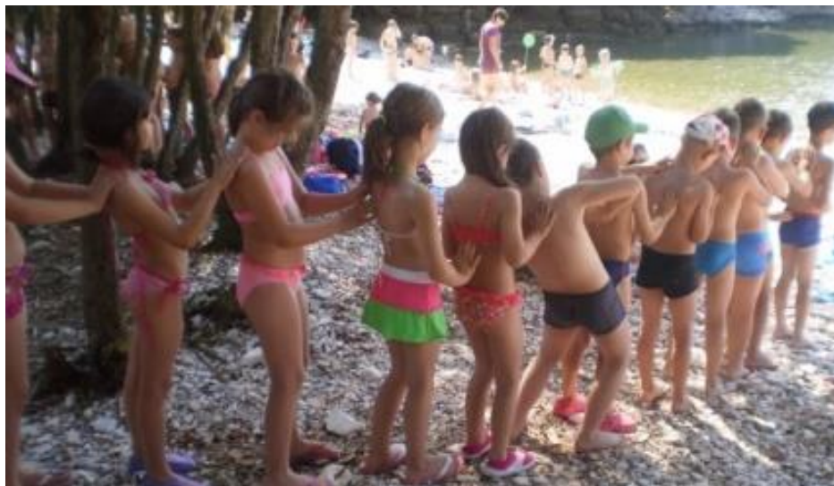
Slika 10. Ljetovanje

odnose se na šetnje, izlete, terenske igre, prirodne oblike kretanja u prirodi. Sadržaji vezani uz vodu jesu prirodni oblici kretanja u vodi, igre u vodi kao i obuka neplivača koja obuhvaća vježbe plutanja, navikavanja na vodu, vježbe disanja i sl.