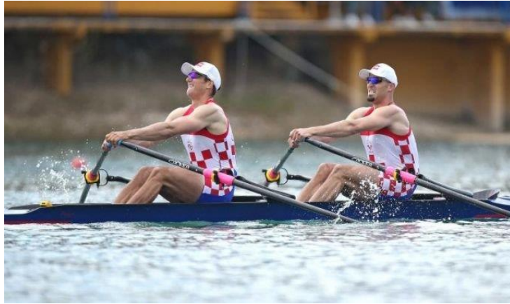
Slika 3. Veslanje (monostrukturalna aktivnost)