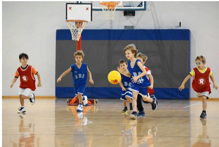
Slika 8. Košarka

Usvajanje jednostavnijih „posebnih zaduženja“ igrača odnosi se na upoznavanje djece s pozicijama (branič, krilo, centar) te individualno usmjeravanje na određenu poziciju. Nakon usvajanja pojedinih tehnika djecu se usmjerava na igranje utakmice . Potiče ih se na prepoznavanje različitih situacija u igri te uočavanje najboljeg rješenja za određene situacije (Sindik, 2008).