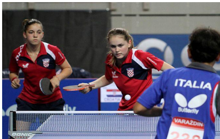
Slika 4. Stolni tenis (polistrukturalna aktivnost)

Izvor: http://sport.hrt.hr/280045/sjajna-forma-brace-sinkovic (10.06.2018.)