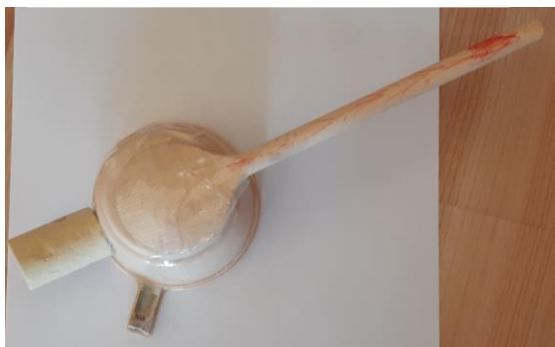
Foto 5: Cannone spara rete (tazzina, mestolo di legno, tappo di sughero) - 5 anni