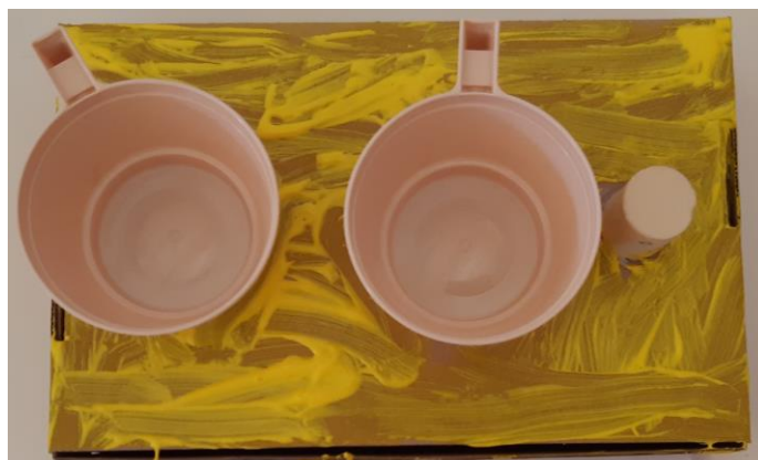
Foto 4: La cucina (scatolone, tazzine, tappo di sughero) - 3 anni