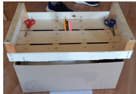
Foto 10: Una casa (scatolone, cuscino, cassetta di legno, matite colorate, forbici) - 6 anni