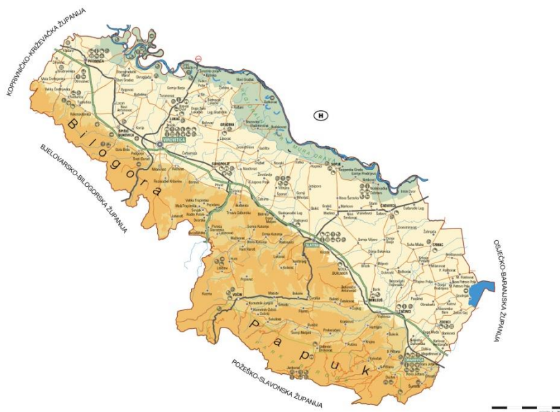
Slika 3 - Reljefni prikaz Virovitičko-podravske županije