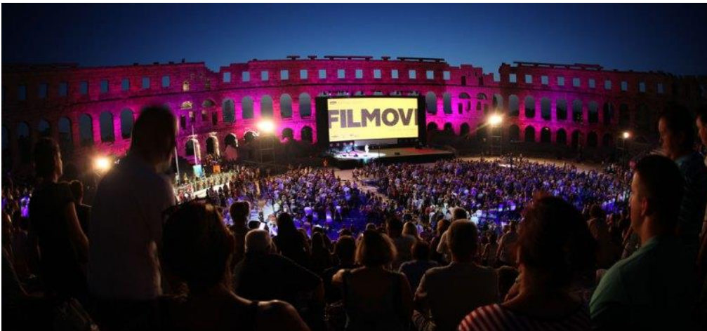
Slika 1. Pula Film festival 11

Zbog velikog interesa i uspjeha, Marijan Roter je sljedeće godine pokrenuo prvi filmski festival - reviju domaćeg filma u organizaciji Udruženja kinematografa Hrvatske, Jadran-filma iz Zagreba i Gradskog kinematografskog poduzeća u Puli. Tijekom održavanja tih revija dodijeljene su nagrade prema glasovima gledatelja