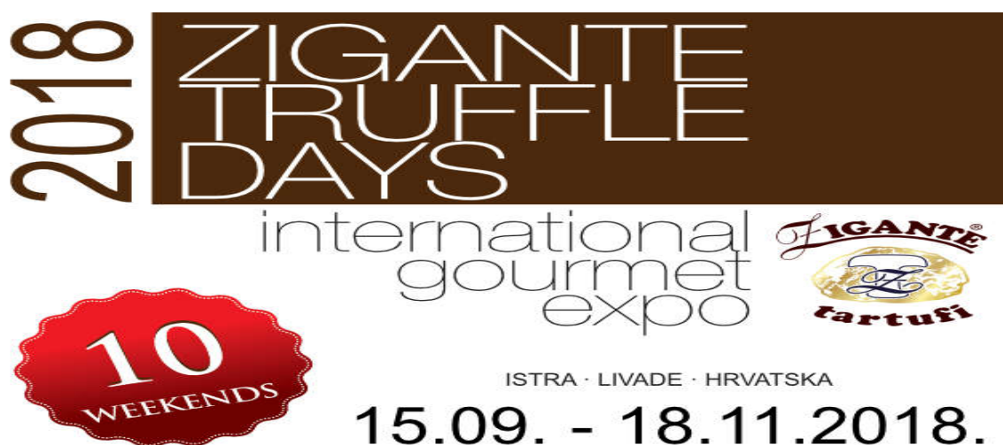
Slika 2. Dani tartufa 2018.