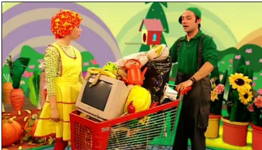
Slika 2: TV vrtić