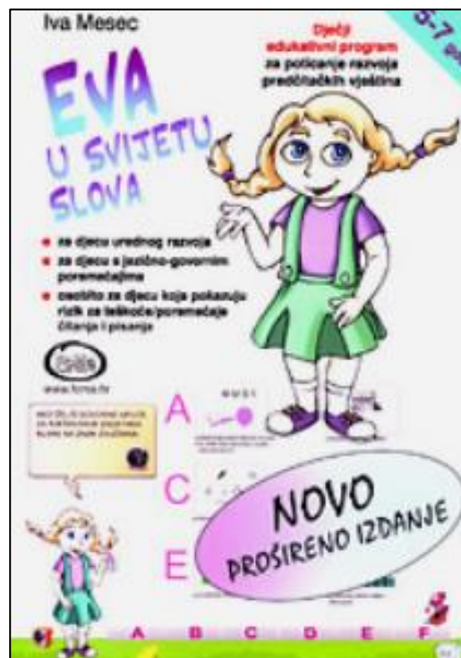
Slika 5: Igrica “Eva u svijetu slova”