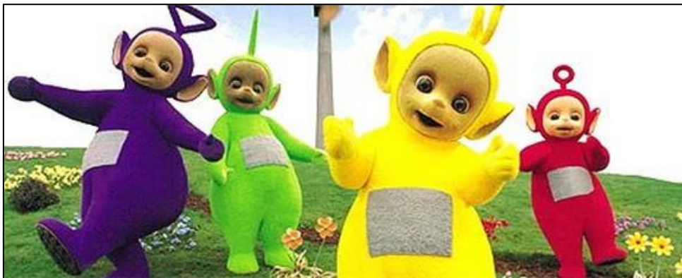
Slika 1: Teletubbies