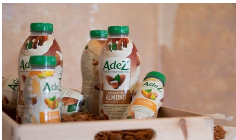
Slika 3. AdeZ