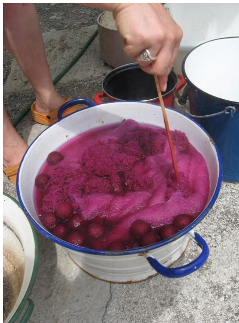
Slika 5. Proces bojanja vune