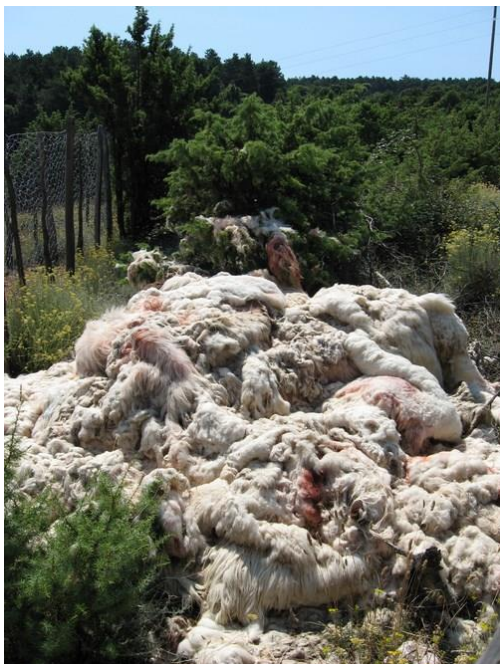
Slika 4. Ostavljena vuna u prirodi