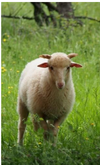
Slika 1. Creska ovca pramenka