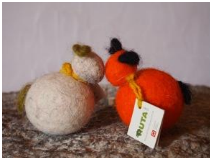
Slika 3. Ručni rad udruge RUTA - ovčice