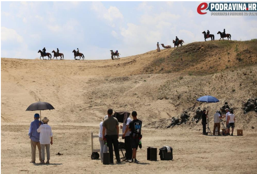
Slika 5: Snimanje filma u Đurđevačkim pijescima