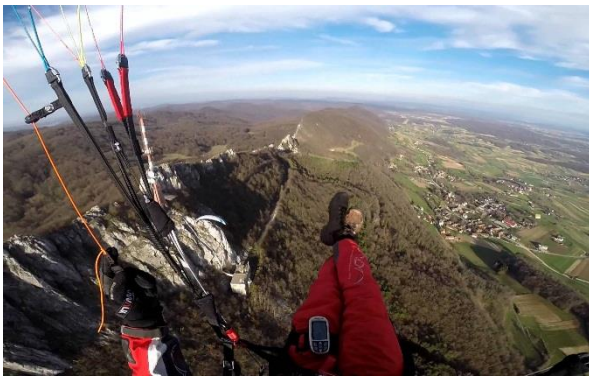
Slika 16: Padobransko jedrenje