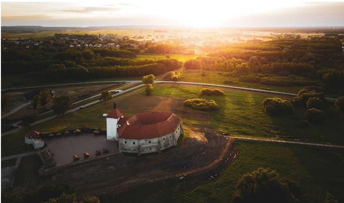
Slika 6: Utvrda Stari grad Đurđevac