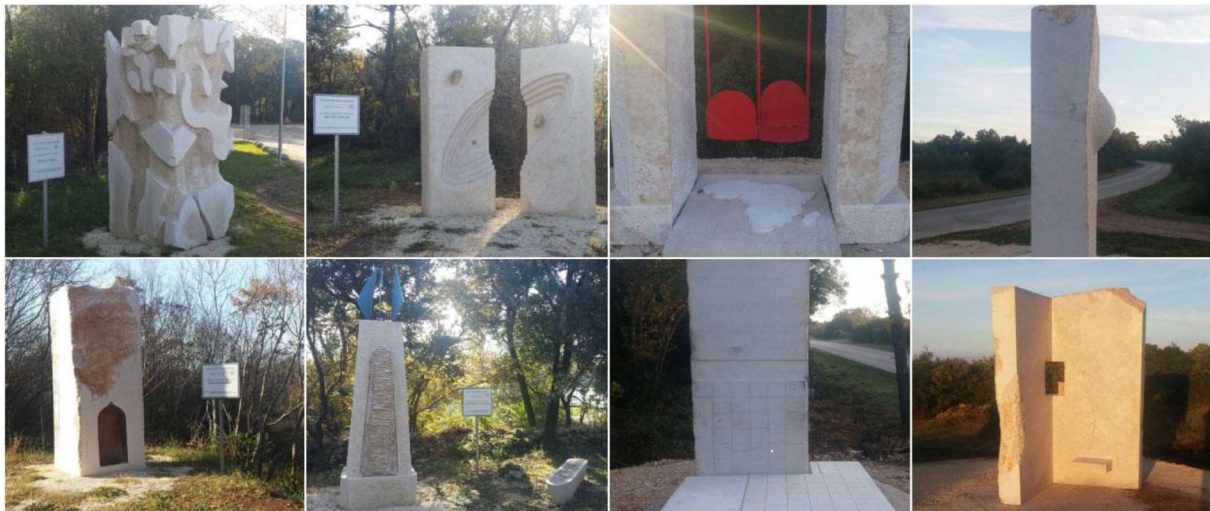
Slika 6. Skulpture postavljene na cesti prema kampu Mon Perin