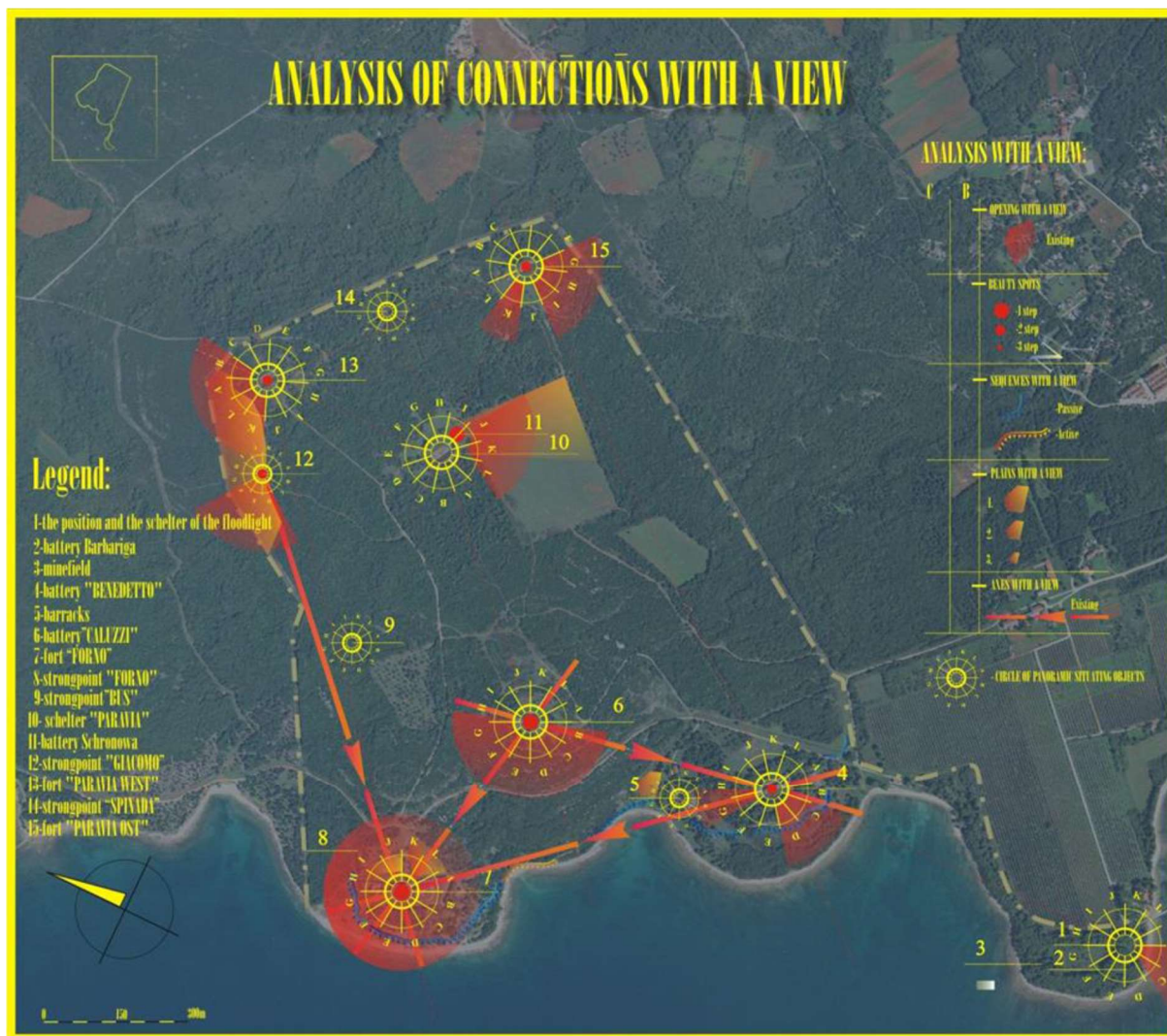
Slika.4. Prikaz rute turističkog obilaska mreže vojnih utvrdi u okolici područja Bala