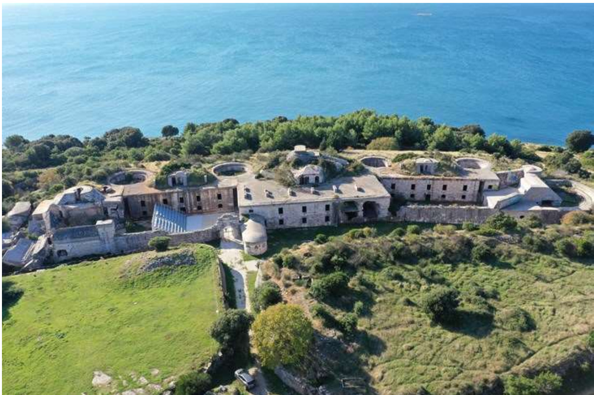
Slika 2. Tvrđava Fort Forno, Bale