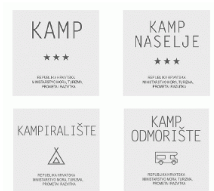
Slika 1. Grafička rješenja standardiziranih ploča za pojedine vrste kampa