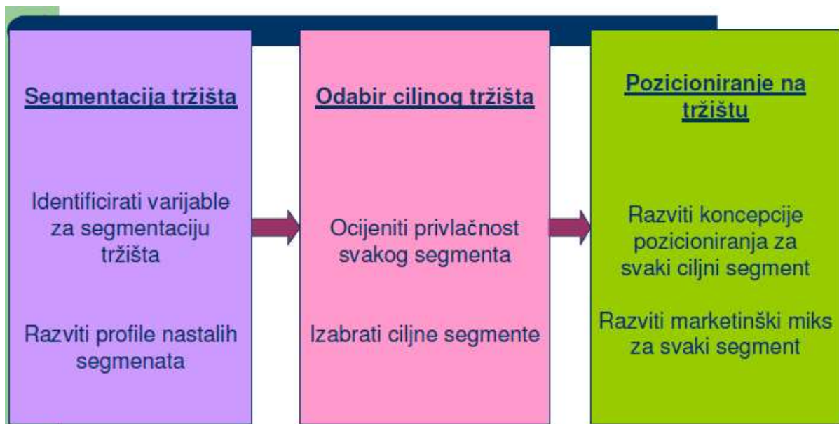
Slika 2. Koraci u segmentaciji tržišta, ciljanju kupaca i pozicioniranju proizvoda