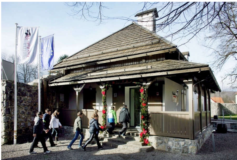
Slika 15. Ivanina kuća bajke

Ogulina. Odlazi se u posjet spomen sobe Ivane Brlić – Mažuranić u čiju je čast uređena u muzeju. Nakon toga u hotelu Frankopan bila bi organizirana tradicionalna ogulinska večera s Ivanom Brlić-Mažuranić i njezinim likovima, a gosti bi prespavali u sobama koje nose imena likova iz bajki npr. Regoč, Kosjenka, Hlapić, Stribor itd. Nakon doručka slijedi putovanje autobusom za Slavonski Brod gdje se održava manifestacija „U svijetu bajki Ivane Brlić-Mažuranić“, a posjetitelji mogu uživati u raznim predstavama i izložbama posvećenim velikoj hrvatskoj spisateljici.