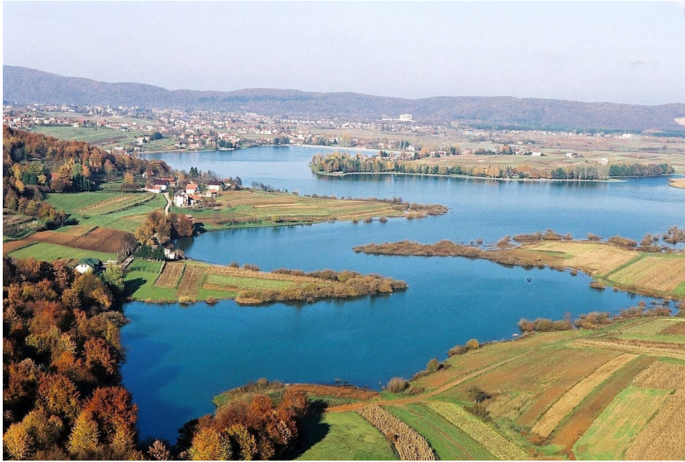
Slika 9. Jezero Sabljaci