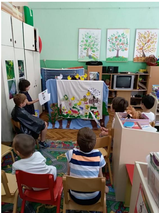
Slika 27. Gledalište.