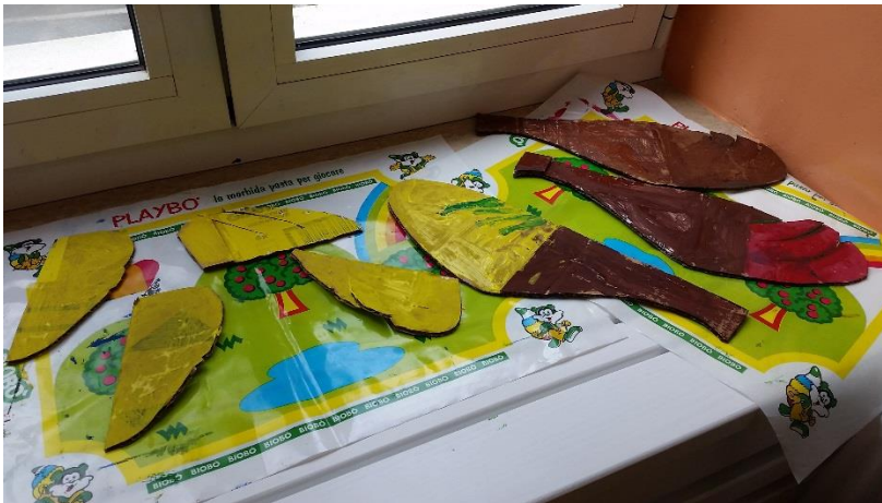
Slika 22. Oslikana perja koja će biti rekviziti za uloge koke, pilića i pijetla.

Rekvizite sam izrađivali od vreća za smeće, kartona i hamer papira. Vreće za smeće koristili sam za izradu krila. Od žutih vreća za smeće izradila sam krila za piliće, a od crne vreće za smeće krila za jastreba. Karton sam iskoristila za izradu perja za koke, piliće i pijetla. Karton je izrezan u obliku perja, a djeca su ga oslikala temperama. Hamer papir koristila sam za izradu kapica, a prije same izrade kapica svakom sam djetetu izmjerila opseg glave. Nakon što sam djeci izmjerila opseg glave, izrezala sam Hamer papir na trakice. Trakice sam izrađivala pomoću mjera opsega glave za svako dijete posebno. Kada sam od trakica napravila za svako dijete kapu, onda sam na svaku kapu zalijepila krijestu koju sam prethodno izradila od crvenog kartona.