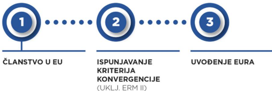
Slika 2: KORACI DO UVOĐENJA EURA

Izvor: Hrvatska narodna banka, https://euro.hnb.hr/-/uvjeti-za-uvodenje-eura