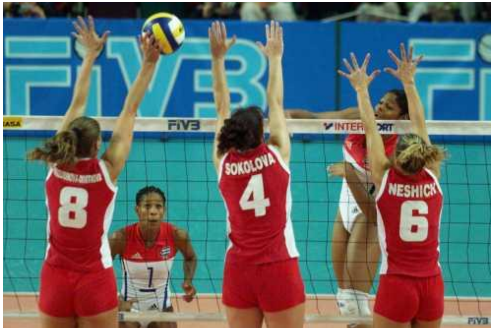
Slika 7. Blok

Izvor: https://images.app.goo.gl/SSm1LWi7sh71W8ok8 08.08.2019.