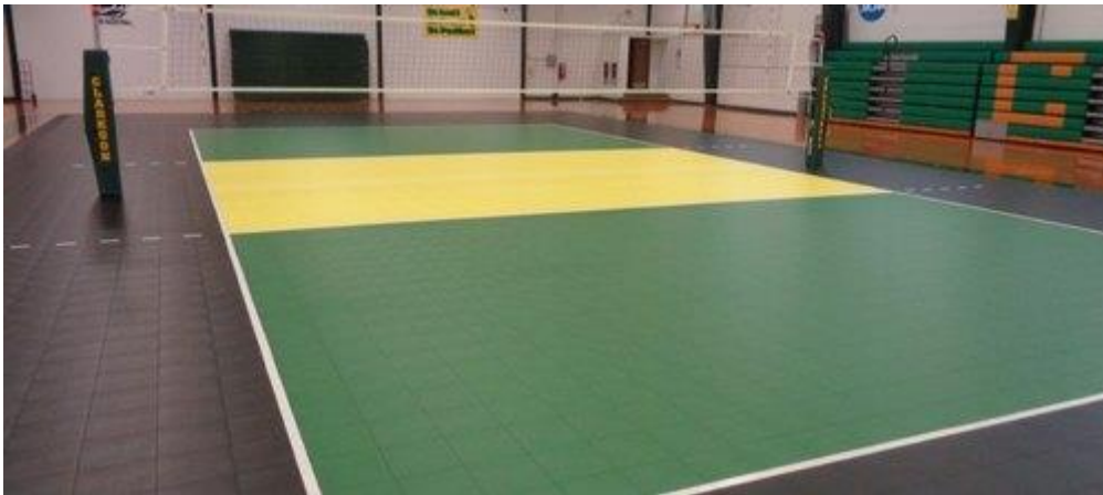
Slika 2. Podloga odbojkaškog terena