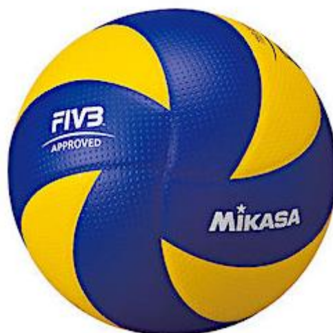
Slika 3. Odbojkaška lopta (MV200)