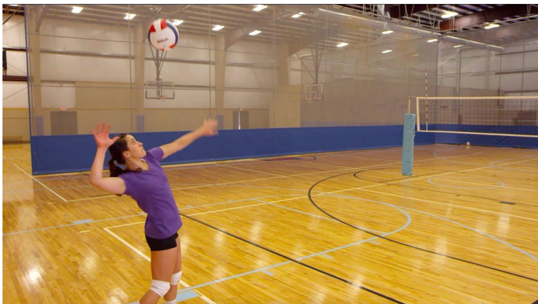
Slika 4. Servis