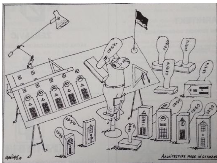
Slika 2. Ironimus: “Architecture made in Germany”