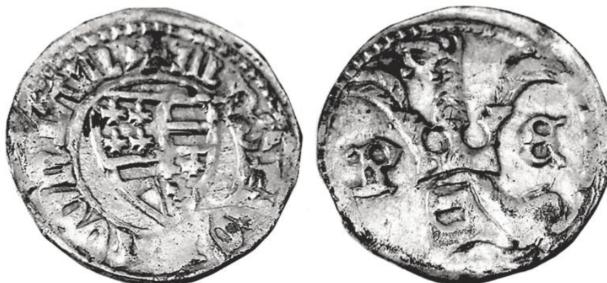
Slavonski banski denar hercega Stjepana (1353.) 57