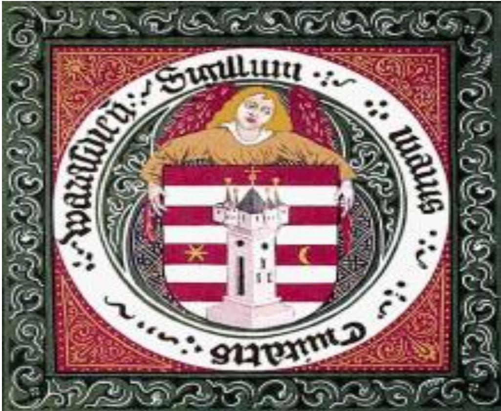
Grb grada Varaždina, 1464. 42

Diploma je pisana latinskim jezikom. U njoj kralj Matija hvali vjernost i službu građana Varaždina. Stoga je kralj želio osobno iskazati svoju zahvalnost stanovnicima grada. Dao im je odobrenje kojim mogu koristiti grb kao i prijašnjih stoljeća. Dozvolio je također da gradska općina od srebra ili bilo kakve druge kovine može izrađivati i svoje pečatnjake. Tim je pečatom grad pečatio dokumente, spise i svjedočanstva. 43