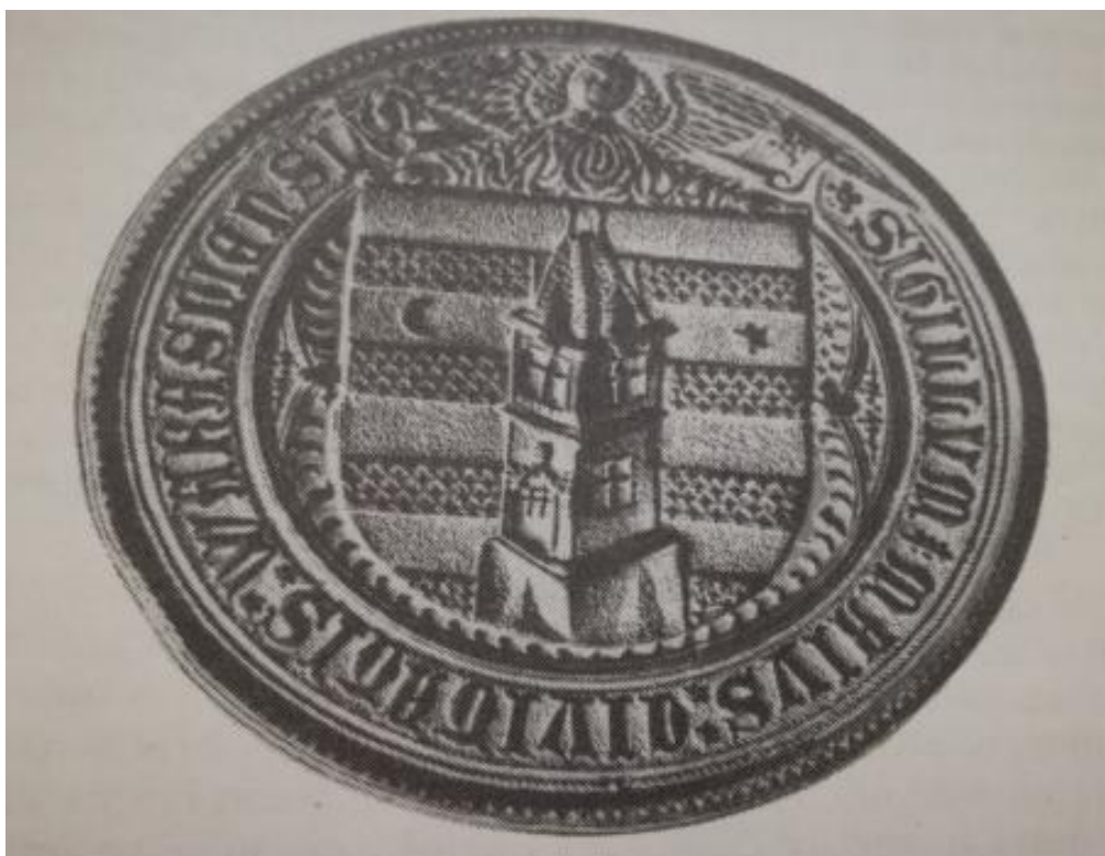
Veliki pečatnjak Varaždina, 1464. 44

Matiju Korvina naslijedio je nezakonit sin Ivan Korvin, kojeg mu je rodila Marija. Posljednjih je godina vladavine Matija svog sina vodio svugdje sa sobom da ga upozna s vladarskim dužnostima. Ivan Korvin nosio je titulu "Herceg opavski i liptovski, te grof hunjadski". 45 On je nakon očeve smrti bio jednim od najozbiljnijih kandidata za upražnjeni tron Ugarsko-Hrvatskog Kraljevstva. Iako je narod u njemu vidio sliku i priliku samog Matije, velikaši su i baruni Kraljevstva s prelatima izabrali drugog kandidata za kralja – poljskog princa i češkog kralja Vladislava II. Jagelovića. Želja hrvatskih staleža bila je da Ivan bude na čelu hrvatskih zemalja pa ga je na proljeće 1495. kralj Vladislav II. imenovao banom Dalmacije, Hrvatske i Slavonije, a ponudio mu je i naslov kralja Bosne pod uvjetom da Osmanlijama preotme Bosnu. 46 Ivan Korvin se potom oženio Beatricom Frankapan u ožujku 1496. godine, 47 kćerkom najuglednijega i najmoćnijeg hrvatskog velikaša, grofa Bernardina