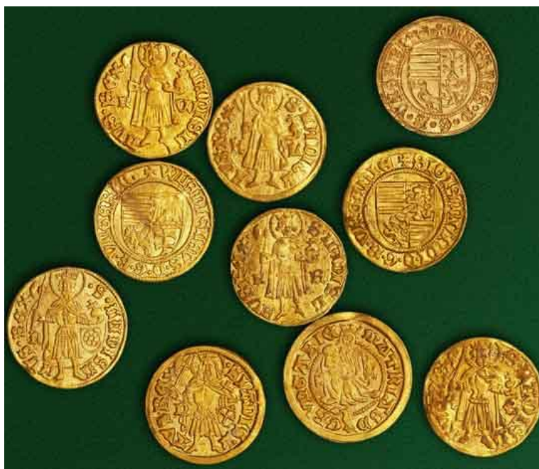
Ugarski zlatni floreni (XV. st.)

Uveden tijekom XIV. stoljeća. Izvori ga donose i pod imenom dukat . Ime floren (florin, odnosno forinta) dolazi od lat. flos kojim se označavalo cvijeće, a nalazilo se na grbu Firence. U petnaestostoljetnoj je Slavoniji jedan floren vrijedio 70 banskih dukata, a ugarski zlatni floren 90 banskih dukata. 60 Ugarsko-hrvatski su kraljevi kao nositelji prava korištenja rudnih bogatstava i nositelji prava kovanja novca ustrajno čuvali čistoću i propisanu težinu svojih novaca pa je i ugarski zlatni floren stoljećima bio na cijeni u bankarskim i poslovima mijenjanja novca diljem Europe. Upravo je zato i postojao veliki odliv tog novca što je rezultiralo kontinuiranim nastojanjem vladara da kovanjem novih zlatnika podmiri tržište novca u vlastitim krunovinama.