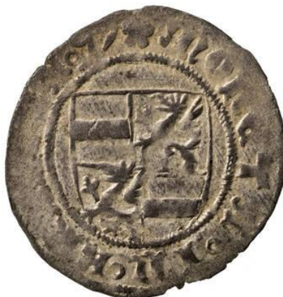
Krajcar bana Jana Vitovca (1459.) 59

Od njemačkog izraza kreuzer (križ). Novčić je nazvan prema dvostrukom križu koji se nalazi na naličju. Sitan novac, mjeden i različite vrijednosti. U XIII. i XIV. stoljeću su se kovnice nalazile u Meranu (Južni Tirol) te u Veroni. Kod nas se krajcar najviše koristio od 1527. godine te isto tako kada je Ferdinand II. bio okrunjen kao hrvatski i slavonski kralj. 58