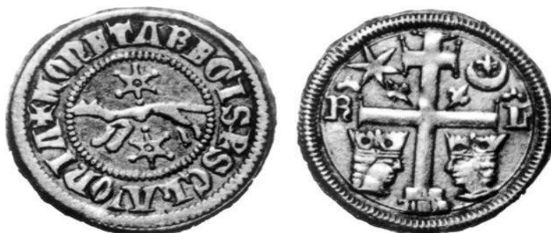
Slavonski banovac kralja Bele IV. 63

Naličje: dvostruki križ, na poprečnoj gredi s lijeve strane nalazio se polumjesec, a s desne strane bila je zvijezda danica. Na donjoj poprečnoj gredi s obje strane nalazile su se okrunjene glave koje su bile okrenute lice jedna prema drugoj. Nad glavama su bila otisnuta početna slova onog kralja, hercega ili bana koji je dao kovati novac.