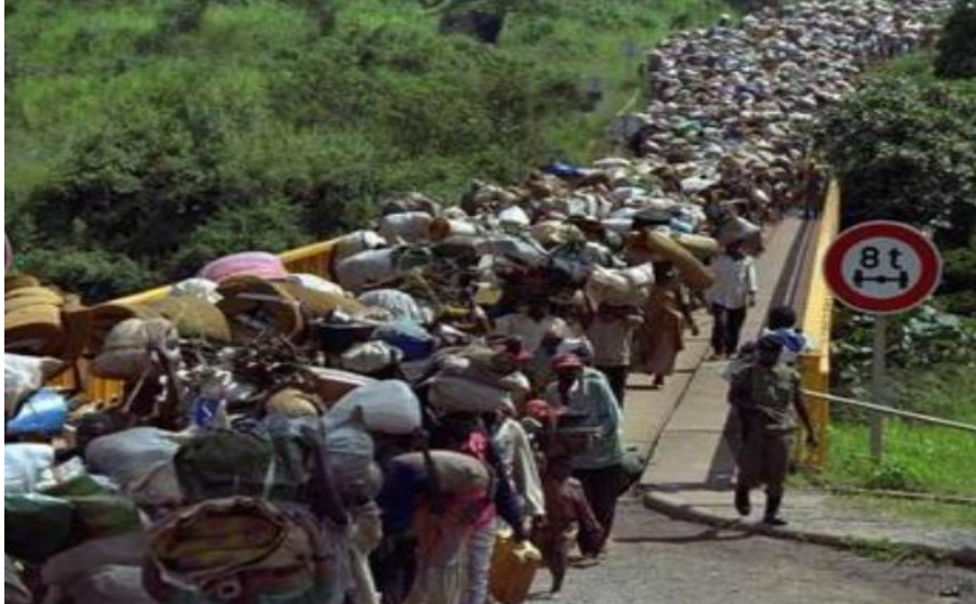
Slika 2.: Izbjeglince iz Ruande