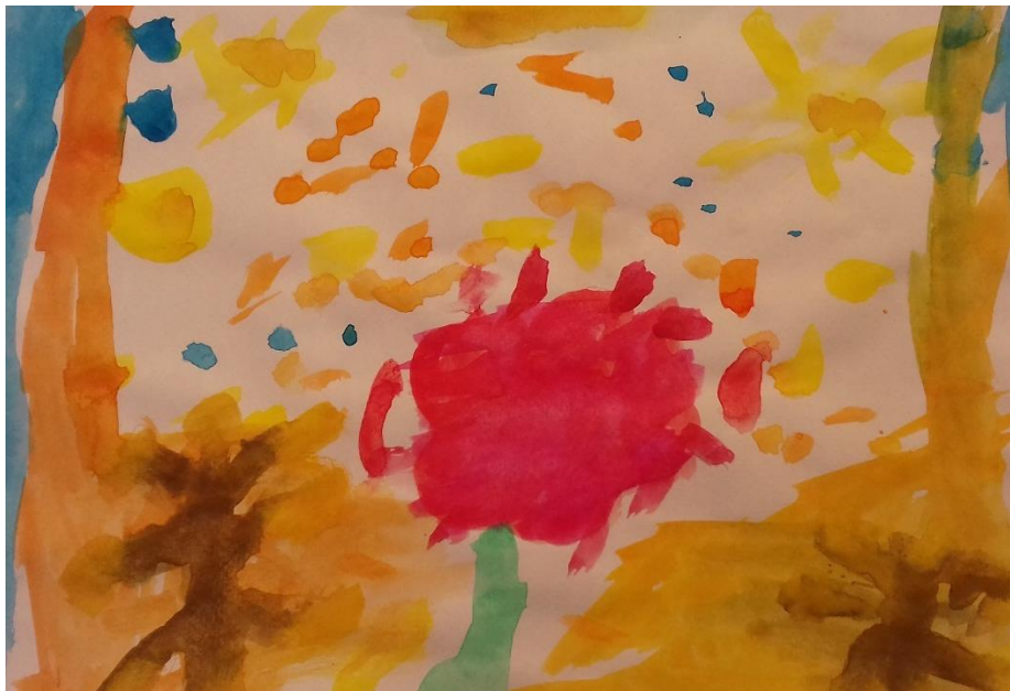
Slika 13. Akvarel

„Nacrta sam cvijet i vjetra koji puše.“ djevojčica (6,5 god)