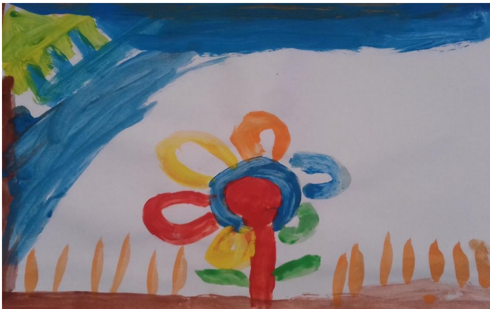
Slika 2. Tempere

„U proljeće raste cvijeće, nacrtala sam šareni cvijet.“ djevojčica (5,8 god)