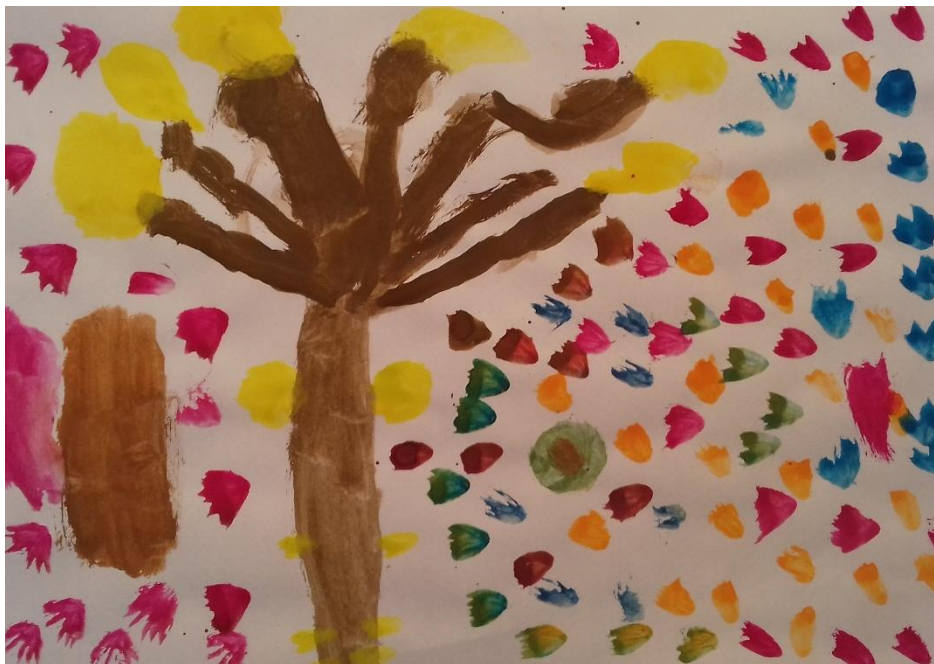
Slika 10. Akvarel

„Jesen je šarena.“ djevojčica ( 6,5 god)