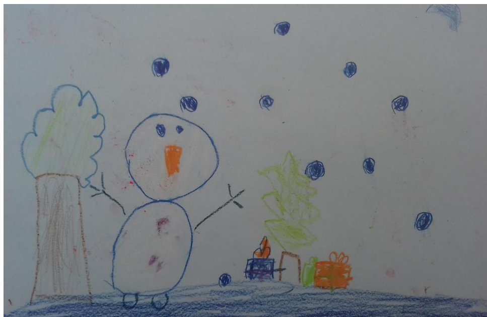
Slika 14. Pastela

„Zimi pravim snjegovića.“ djevojčica (6,5 god)