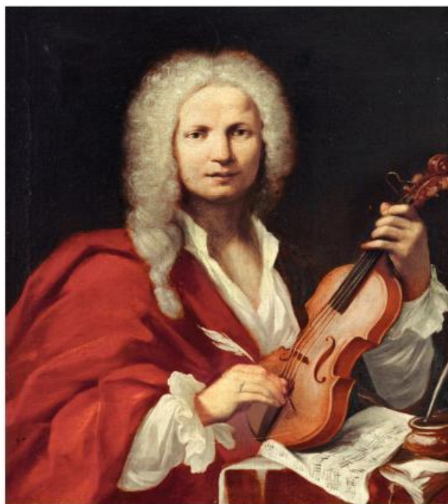
Slika 1. Antonio Vivaldi