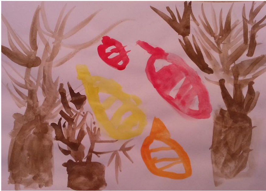
Slika 12. Akvarel

„Ovo su drveća s kojih pada lišće, lišće je žute i crvene boje.“ djevojčica (6,3 god)