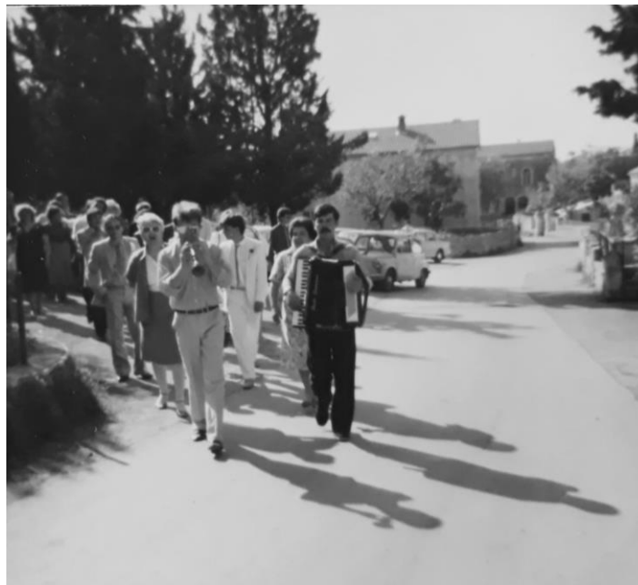
Slika 5. Svadbena povorka u Raklju 1984.

Svatovi su u Istri izgledali puno drugačije nego što izgledaju danas. Razlika se odmah uviđa i u samoj odjeći koju su mladenci nosili na vjenčanju – to je bila narodna nošnja. Zatim, sam broj uzvanika bio je oko 20, zbog velike neimaštine pa se nije mogla pripremati velika gozba za velike svatove kao danas. Ipak, roditelji mladenaca trudili su se što bolje pripremiti svatove kako ne bi nedostajalo hrane i piće zbog pitanja časti i ugleda. Osim gozbe, važna je bila i glazba pa su instrumenti koji su predvodili svatove bili zvukovi roženica, harmonike, miha i vijulina, a glavni ton bilo je pjevanje i sviranje na tanko i debelo. Slika koja je priložena u nastavku fotografirana je u Raklju 1984. prilikom odlaska po mladu, što je vremenski kasnije nego običaji koji su objašnjeni, no vidi se da su se određeni običaji zadržali – glazba je prva u svadbenoj povorci.