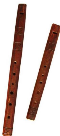
Slika 24. Jedinke