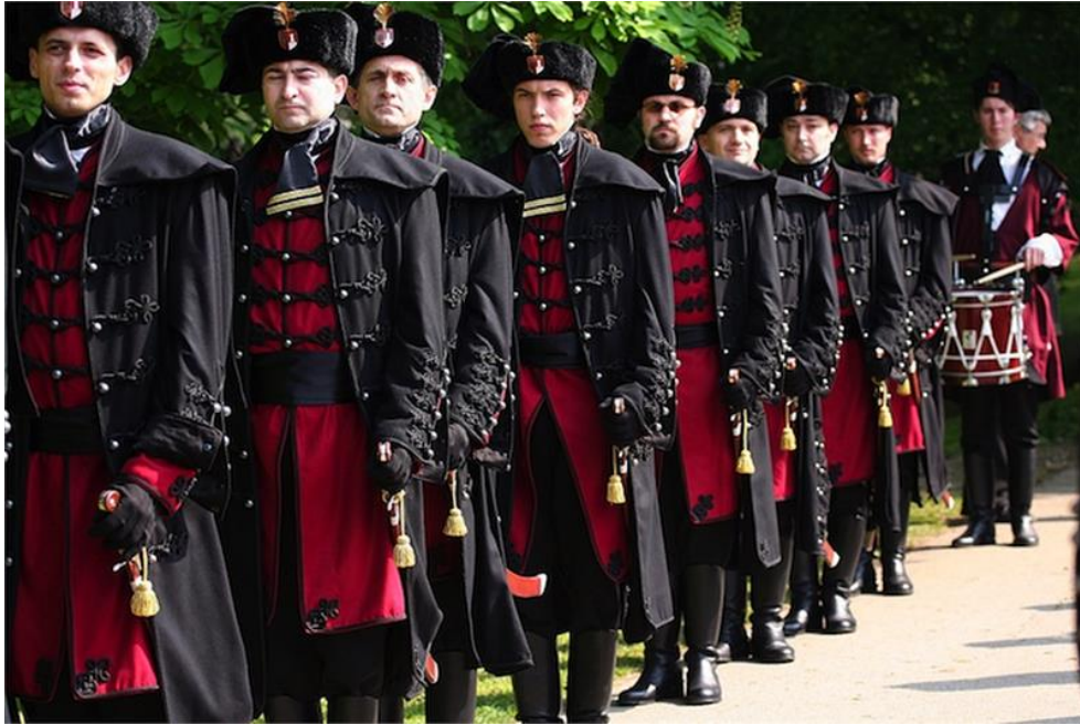
Slika 5. Međimurje danas „čuva“ Zrinska garda grada Čakovca