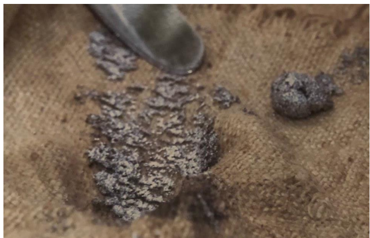
Slika 11. Priprema za završetak amalgamacije