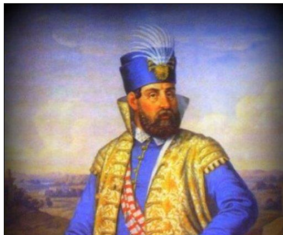
Slika 3. Nikola Zrinski Sigetski

Grad Čakovec je središte Međimurja u kojem se nalazi dvorac obitelj Zrinski. Sam uspon obitelji Zrinski, koja je ujedno bila i najmoćnija hrvatska plemićka obitelj na području Međimurja, započeo je za vrijeme vladavine Nikole Zrinskog Sigetskog koji 1546. godine dobiva Međimurje od kralja Ferdinanda Habsburškog za zasluge u borbi protiv Turaka. Dvorac Zrinski izgrađen je u Čakovcu da bude obrana od turskih napadanja. Još dan danas uz neke male pregradnje, utvrda svjedoči bogatstvu i moći obitelji Zrinskih. Nikola Zrinski Sigetski pogiba 1566. godine kod Sigeta u borbi s Turcima, te ga na prijestolju nasljeđuje njegov sin Juraj Zrinski.