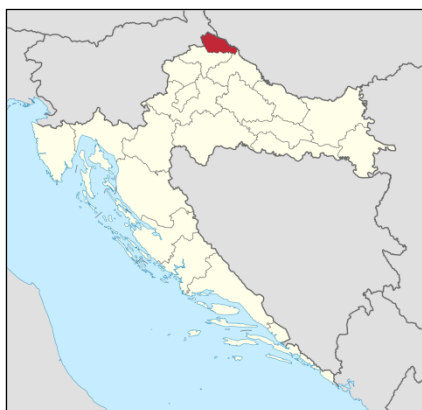
Slika 1. Geografski smještaj Međimurja

Gledajući kartu Međimurja, istočno od pruge Čakovec-Mursko Središće nalazi se Donje Međimurje, najplodniji dio naše županije. Razvijeno je stočarstvo, ratarstvo i u novije doba, industrija. Donje Međimurje imalo je mnogo problema i opasnosti od poplava, pošto su to najniži dijelovi uz rijeke Muru i Dravu, međutim najnovijim tehnologijama te radovima protiv poplava, ta opasnost gotovo da je nestala. Sama gustoća naseljenosti te broj naselja Donje Međimurje svrstava kao vodeći kraj, ne samo u Međimurskoj županiji, već i u Republici Hrvatskoj.