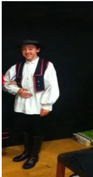
Slika 20. Muška narodna nošnja

Današnja Međimurska narodna nošnja razlikuje se u donjem i gornjem Međimurju. U Donjem Međimurju i kod muškaraca i kod žena prevladavaju crna i bijela boja, dok u gornjem Međimurju narodna nošnja žena različitih je boja, a kod muškaraca sve više se uvodi „gospodsko“ oblačenje.