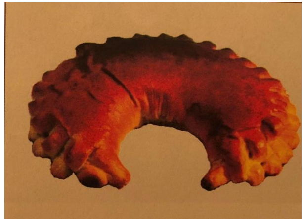
Slika 17. Perec