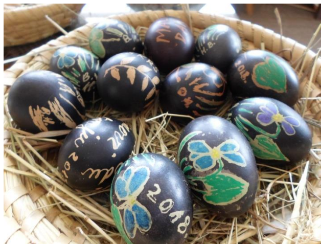
Slika 15. Međimurska „crna“ pisanica

"Naime, na pisanicama pretežu ili su isključivo samo cvjetni motivi, što sukladno općoj sklonosti međimurskog čovjeka cvijeću – na opravi, svatovskim znamenjima, osobito pak u narodnoj popijevci ( Vehni, vehni fjojlica, Rožica sem bila, Klinčec stoji pod oblokom i druge). Tekstovi pak na tim pofarbanim jajcima ne će se odlikovati naročito umjetničkim vrijednostima, najčešće su samo informativni („Dar od tece“, „Dar od srca“, „Ovo srce od ljubavi se daje“...). No, drugo u vezi tih tekstova iznimno je važno – potreba i sklonost da se jezično izrazi (k tome još i „ženska glava“), da uputi pouku (i) pismom, što je – pripomenemo li da izradu pisanica možemo pratiti otprije stotinjak godina, dakle, u tadašnjim čvrstim patrijarhalnim odnosima – osobito vrijedna kulturološka činjenica, koja potvrđuje visoki umjetnički, ali i obrazovni standard Međimuraca još tamo početkom 20. stoljeća!" (Hranjec, 2011:135).