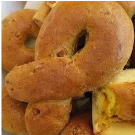
Slika 16. Vrtanj

„Poseban je običaj u Donjem Vidovcu pečenja vrtanja za Uskrs – Vuzem . Vrtanj izgleda kao perec samo što je mnogo veći, tako da se manjem djetetu može staviti oko vrata. To je čisto, tvrdo i ukusno tijesto koje se također peče u krušnoj peći i ne kviri se. Stariji su ga rado drobili u kuhano mlijeko. Svaki pastir (kanas, čordaš ili čikoš) dobiva za Uskrs u svakoj kući svoj posebni, za njega pečeni vrtanj .” (Hranjec, 2011:137)