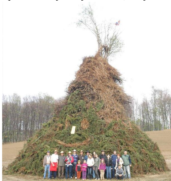
Slika 14. Vuzmenka

“Smisao je vuzmenke višestran. U prakorijenu običaja leži obredna funkcija (kao i kod ivanjskih, jurjevskih i drugih krjesova) da se ognjem otjeraju zle sile od naselja, ljudi i polja. Potom „preko garišta iza vuzmenke tjerala se stoka da bude zdrava i da joj ništa ne nahudi; dalje, osobita moć ugaraka sa garišta, koji se stavljaju na njive ili vrtove pa će tu širiti radost bilja; naposljetku i vjerovanje da sve dotle neće zle sile (vještice, demoni) imati vlasti, dokle dopre svjetlo (ili dim) tih krjesova. Današnji smisao vuzmenki nije ni odredni ni sveti nego u prvom redu društveni. One su tek značajan oblik društvenog okupljanja i nadmetanja : uz njih se veseli u Velikoj noći i potiče se natjecateljski duh.” (Hranjec, 2011:132)