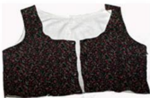
Slika 18. Prsluk

„Na košulju se oblačio prsluk od pustene tkanine s osnovnom crvenom bojom, potom kratka bunda i na kraju dugačak „zobun“ iz grubog sukna, bez rukava i ovratnika. Međimurci su šili u poseban „zobun“ za praznike, ali taj nije bio iz grubog platna, već iz pustene tkanine. Bio je crvene boje i na sebi imao gajtane.“ (Gönczi, 1995:104).