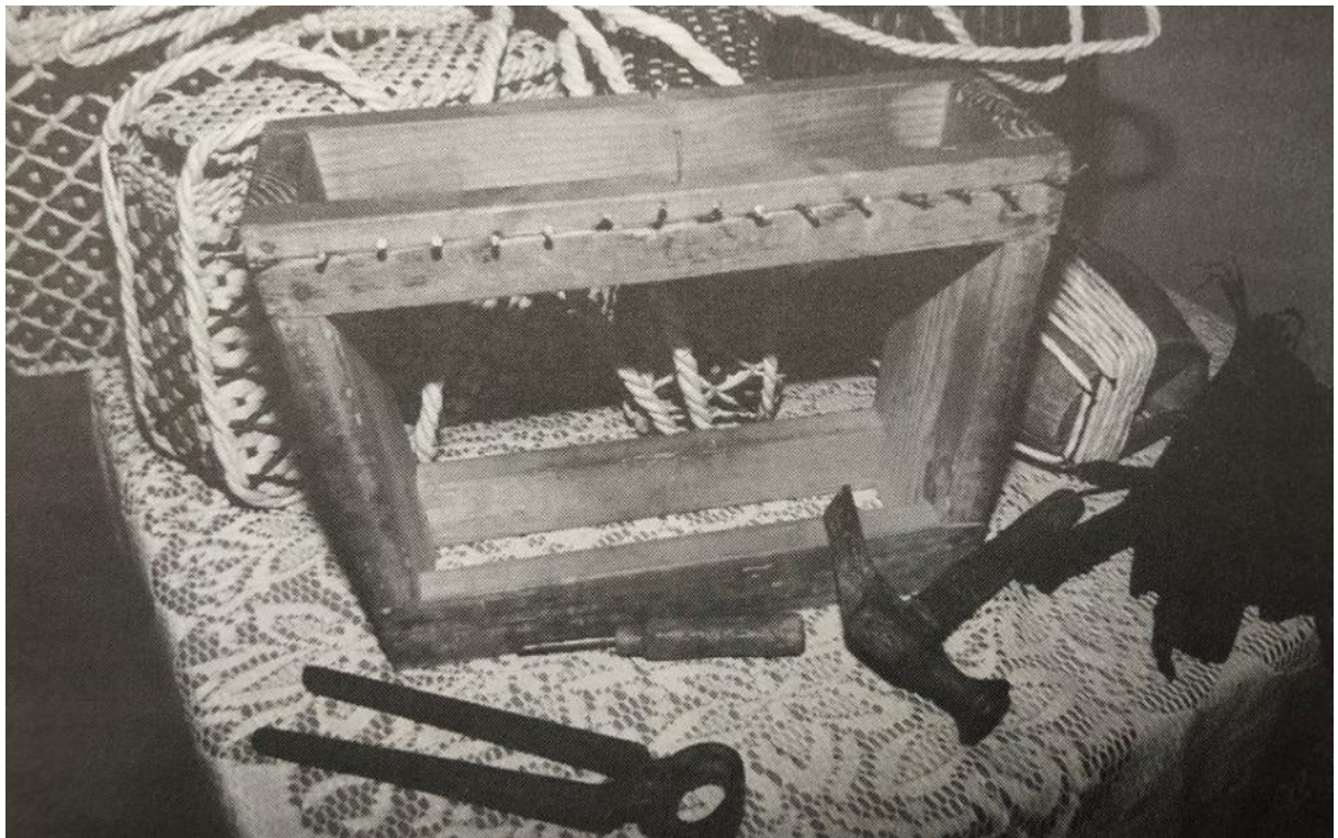
Slika 6. Pribor za pletenje (modla, hakel, kliješta, čekić)

Način na koji su se dekorirali, odlučivali su sami naručitelji ili kreativnost osobe koja je plela. Uz kalupe je za pletenje bilo potrebno koristiti i škare za oblikovanje, kliješta, te hakel- "specifični metalni klin pomoću kojeg su se ispreplitale bobice. Haklom su se pletačice služile u svakoj vrsti oblikovanja i manipuliranja bobicama, tj. pletenja cekera umotanim komušinjem."(Cimerman, 2003:65). Jedan od važnih koraka u samom procesu izrade bilo je i sumporenje, kojim se iz komušinja uklonile štetočine.