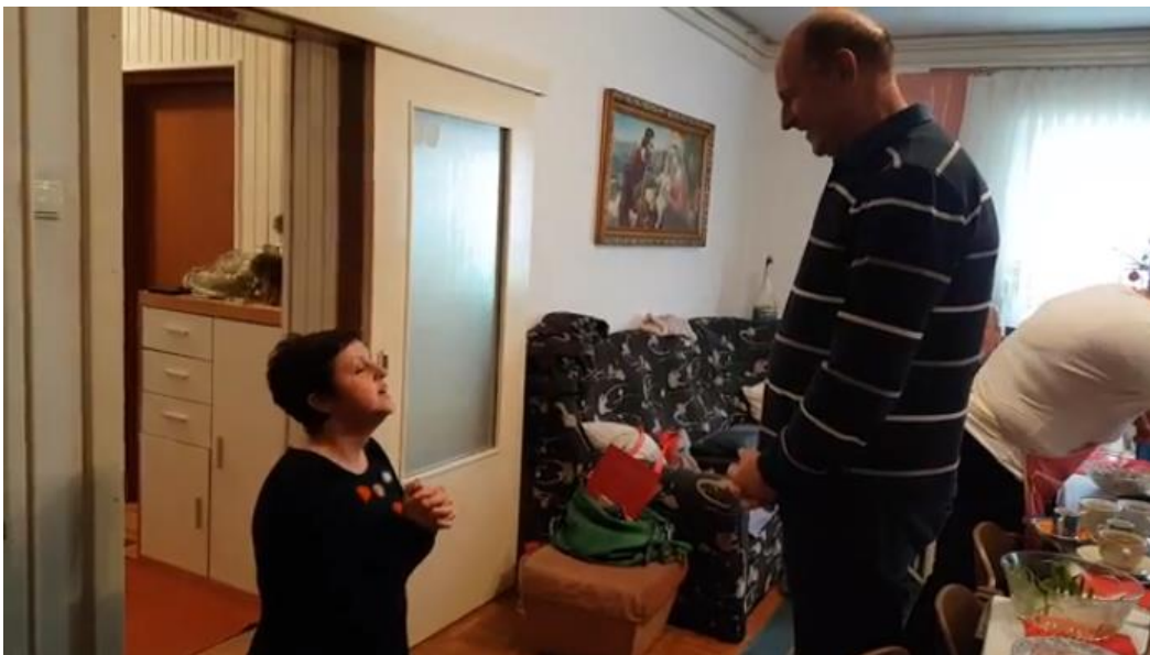
Slika 12. Međimursko „bajanje“ po kućama

Svrha je njihova jasna: donošenjem poljoprivrednih proizvoda i predmeta u kuću željelo se da toga ne ponestane sljedeće godine, tj. da priroda podari što je izloženo: bacanjem graha željelo se što više peradi, da bi se u bajanju i koljanima to direktno izrazilo govorom. Sve je to razumljivo kad se podsjetimo koliko je seljak ovisan o zemlji na kojoj živi.