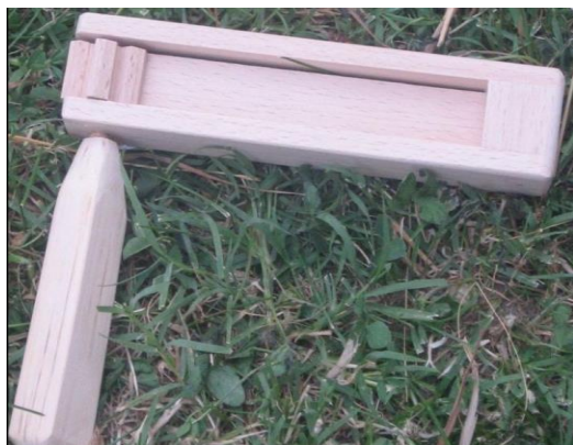
Slika 23. Čegrtaljka