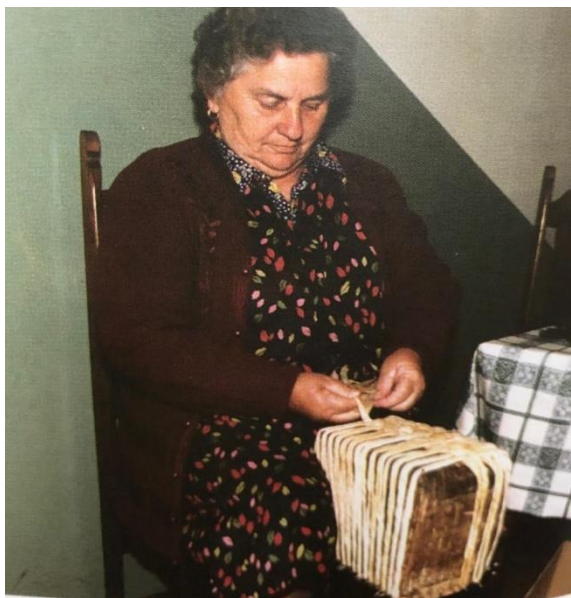
Slika 7. Početak pletenja cekera

Bočna strana cekera, osobito veći dio njezine donje strane ( ovisno o vrsti cekera) plela se ispreplitanjem bobica kroz već postojeće kolce, njihovim horizontalnim ispreplitanjem, uokolo cekera, slijeva na desno. Kod tog su se ispreplitanja pletačice obvezno ( ili najčešće) služile haklom i istovremeno su bobice stalno potiskivale prema dnu cekera da im ceker ne bude – rijetki.