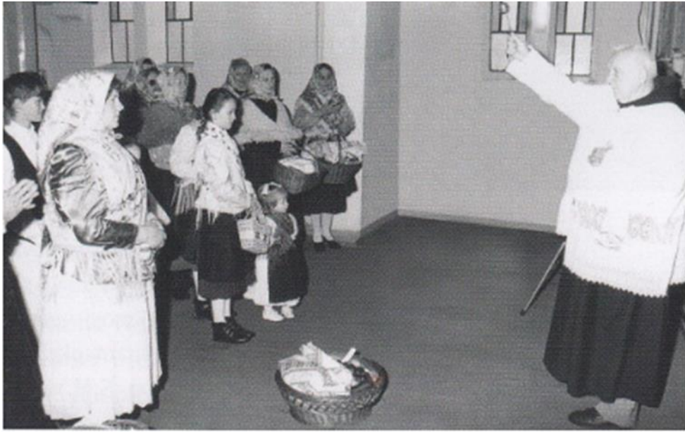
Slika 13. Blagoslov jela