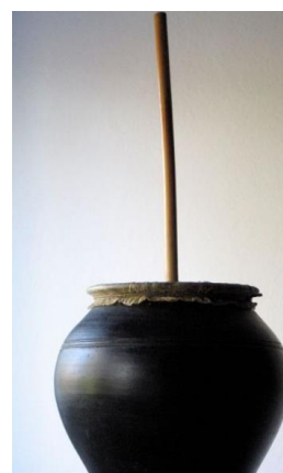
Slika 25. Lončani bas