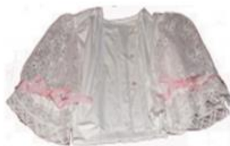
Slika 19. Košulja