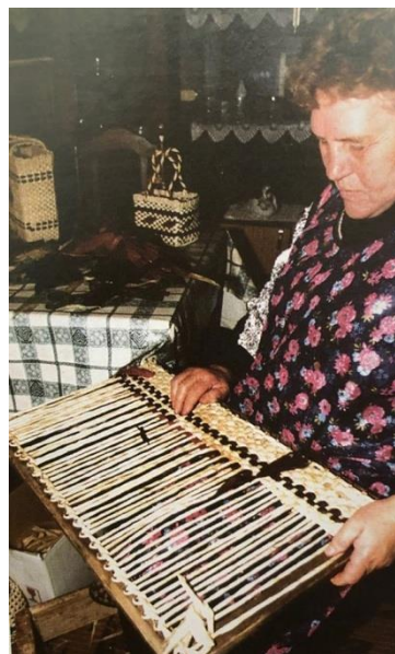
Slika 8. Druga faza pletenja