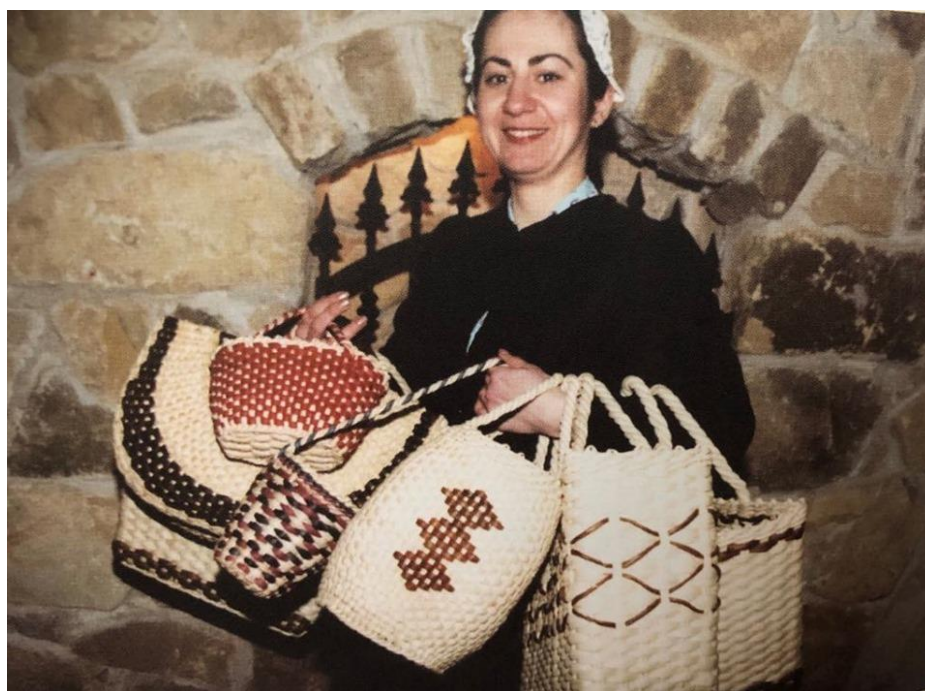
Slika 9. Djevojka sa cekerima spremnim za prodaju