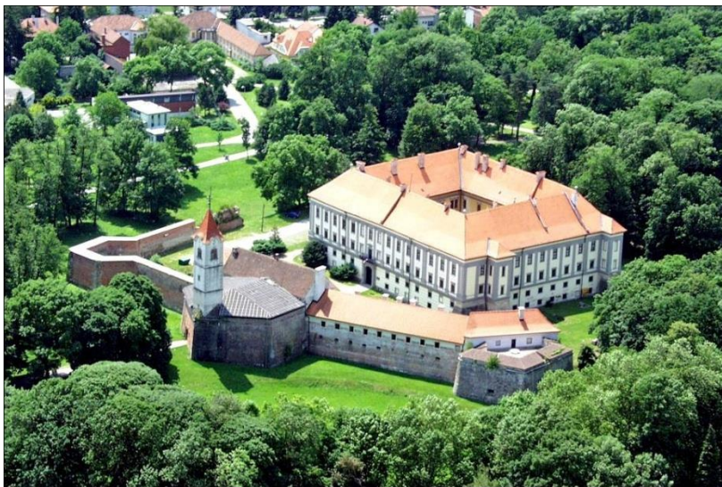
Slika 4. Dvorac Zrinski u Čakovcu

Možemo zaključiti da su Zrinski bili najmoćnija hrvatska plemićka obitelj koja je vladala Čakovcem i Međimurjem u 16. i 17. stoljeću. Branili su Hrvatsku od Turaka, ali i od prevlasti carske habsburške obitelji nad Hrvatskom. Poticali su kulturni život, proizvodnju i trgovinu te je za vrijeme Zrinskih Međimurje bilo veoma financijski moćno te razvijeno.