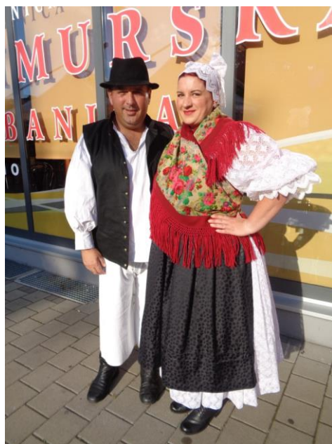
Slika 21. Današnja narodna nošnja

„U Donjem Međimurju svakodnevna odjeća žene sastoji se od jednostavne bijele košulje i kratke suknje, a preko nje veže se plava pregača. Gornji dio odjeće čini crveni ili bijeli prsluk, sprijeda četvero-uglasto izrezan. Na njega dolazi velika marama, bunda ili „bajka“. Suknja je snježno bijela, otraga naborana. Na njoj je crveni pažljivo ušitkan pojas. Košulja je iz finog platna s ispupčenim, naboranim i čipkastim rukavima. Kontrast bijeloj boji čini crni svileni prsluk, krznena „bajka“, mentenica i pregača. Prsluk je vrlo lijep, gotovo svugdje sprijeda prošaran s tri do četiri prsta širokim porubima od gajtana“. (Gönczi, 1995:108)