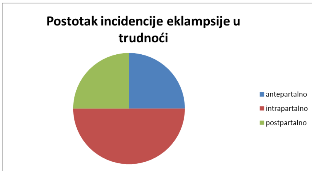
Grafikon 1. Postotak incidencije eklampsije u trudnoći (Habek, 2017).

Eklampsija se najčešće pojavljuje intrapartalno u 50% slučajeva, u 25% slučajeva pojavljuje se postpartalno i antepartalno se pojavljuje u 25% slučajeva (Habek, 2017).