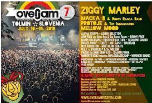
Fotografija 3. Supkulturni festival reggae glazbe u Tolminu