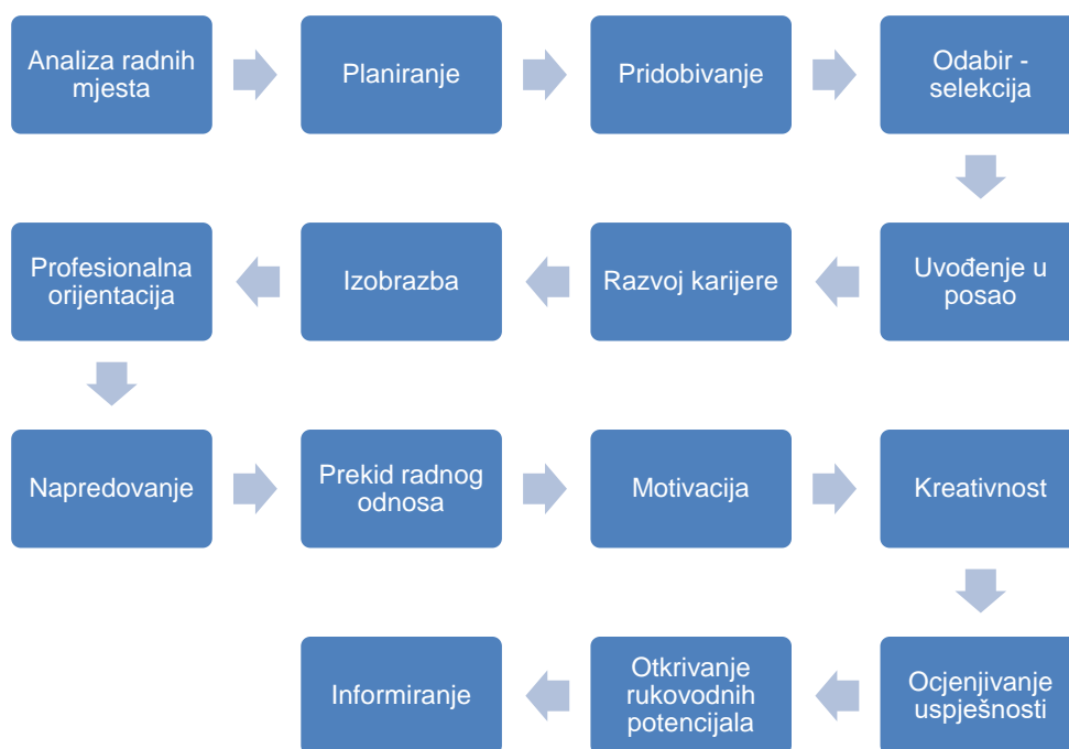
Slika 1. Shematski prikaz funkcija upravljanja ljudskim potencijalima