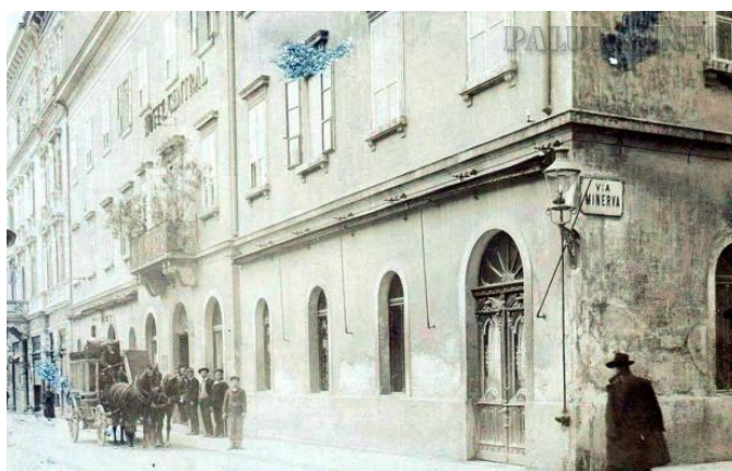
Slika 2. Hotel Centrale na uglu Via Minerva (današnja Maksimijanova ulica)