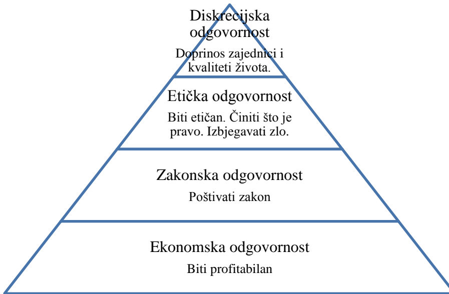
Graf 2. Hijerarhija DOP-a