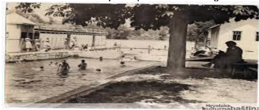
Slika 1. Tuheljske toplice sa starih razglednica