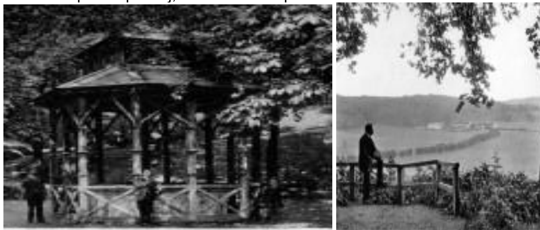
Slika 3. Kupališni perivoj, Varaždinske toplice