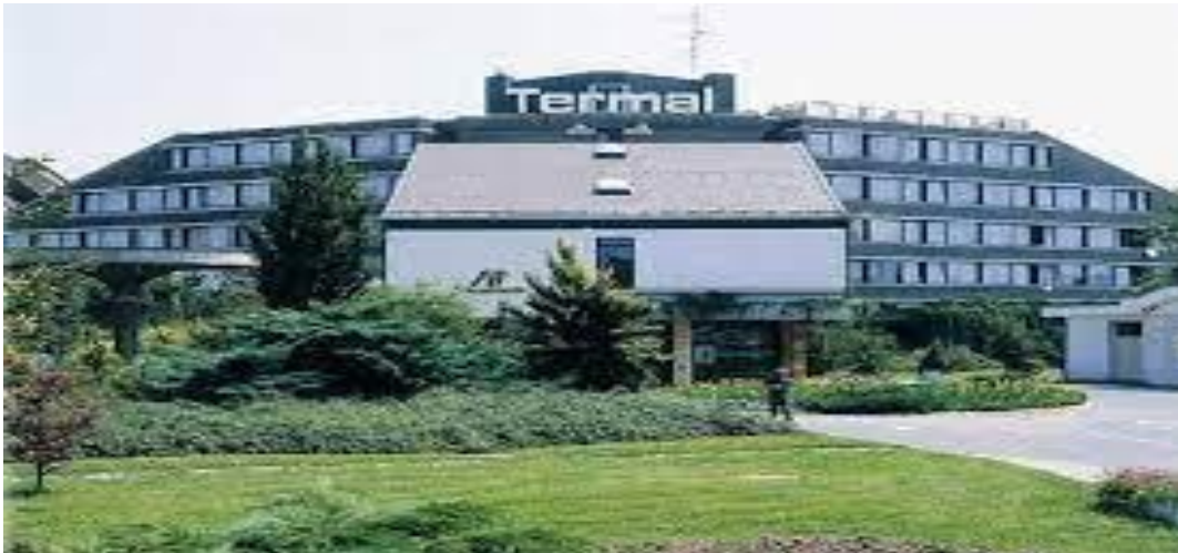
Slika 4. Hotel Termal