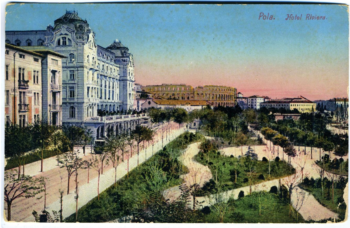
Slika 4: Hotel Riviera